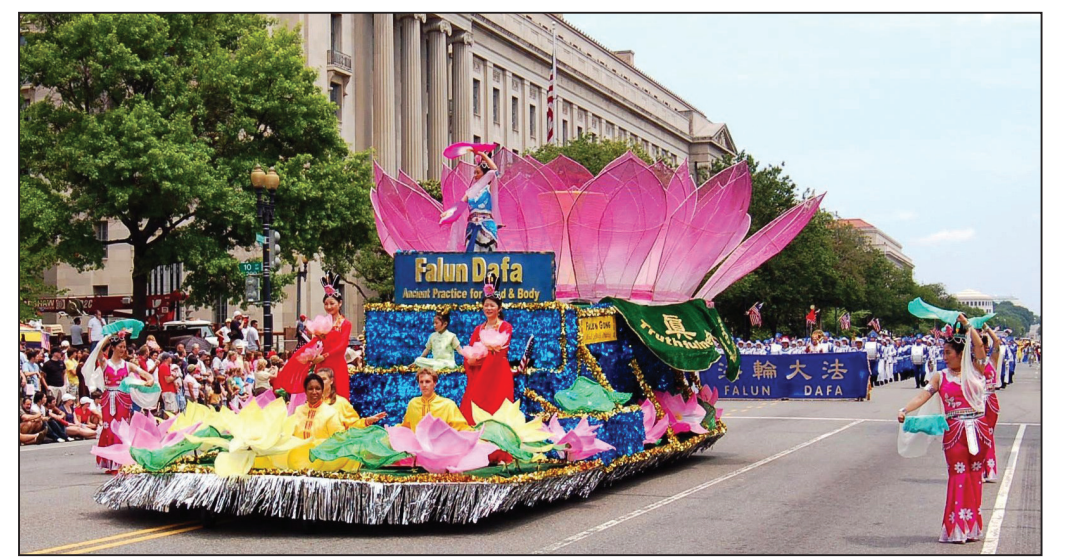
法輪功學員參加首都華盛頓DC國慶大遊行

七月四日晚，在費城的本杰明-富蘭克林大道上，天國樂團以中華傳統的古裝登場，隊員們身著藍白相間的宋朝文武官員的服飾和頭飾，胸前寫著大大的「樂」字，在藍天白雲的襯托下，格外耀眼和令人振奮，贏得了觀眾們的喝采和掌聲，特別是