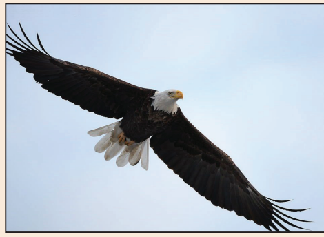
熬鷹、「轉化班」和退黨 (第三版)