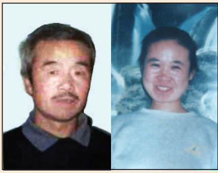
丈夫被害死、女兒被重判 (第二版)