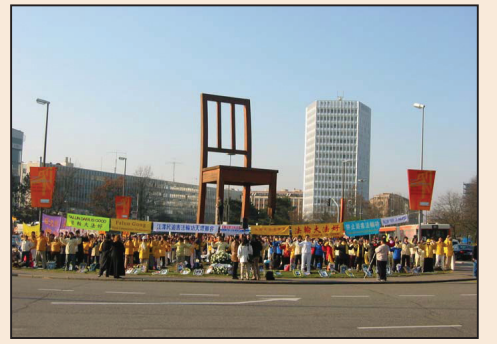
聯合國人權年度報告連續抨擊中共 (第六版)