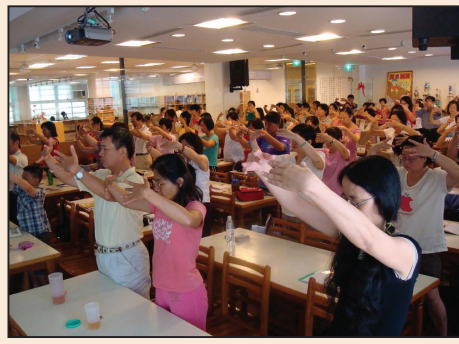
教師學煉法輪功 (第四版)