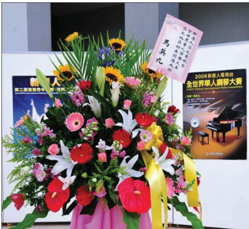
現場一千多位觀眾。

本大賽亞太區初賽結果，九十二位參賽共有三十人入圍，將在八月間一起去美國紐約參加複賽，把華人的歌聲帶進國際舞台。女子組美聲唱法的成績最佳，共有二十名選手入圍，男子組美聲唱法居次，共有七名選手入圍。男子組民族唱法三名選手入圍，女子組民族唱法入圍者暫缺。同時，入圍者於七月六日下午在「入圍頒獎典禮暨入圍選手音樂會」接受「亞太初賽優勝」獎狀後，以最美好的歌聲呈現給