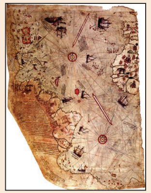
史前文化遺蹟與文明 的週期發展(第八版)