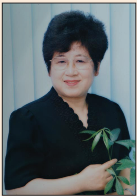
大連西崗法院陷害 女企業家(第一版)