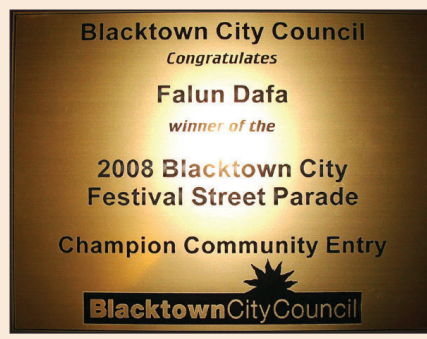
悉尼地區節日大遊行 法輪功團體獲頭獎(第七版)