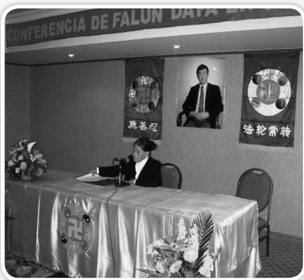
住在那裏的村民，紛紛要求學煉法輪功。

西人學員 FELICITA 去年到日本探親，把「法輪大法好」帶到日本親人的跟前。一位患足疾無法行走的親人，學煉法輪功後可以行走的事實，震動了居