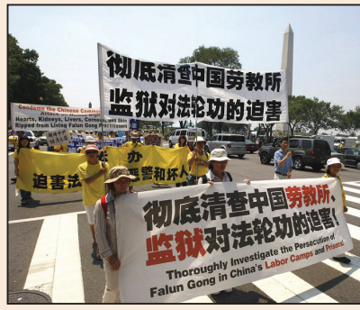
九年反迫害 彰顯法輪功和平理性(第三版)