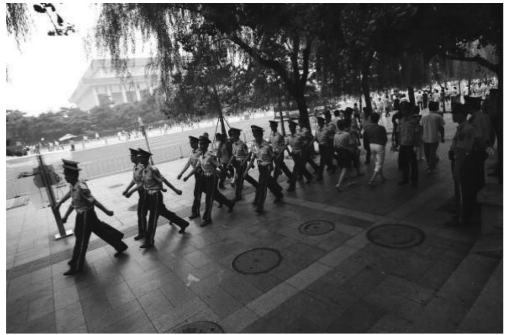
奧運期間中共如臨大敵，北京城內佈滿武警

中共在二零零一年申辦奧運的時候，口口聲聲改善人權，還許諾新聞自由，示威的自由。結果七年下來，人權反而惡化，對法輪功的迫害就是最典型的例子。看看中共所謂的「允許示威」的作秀到了何等可恥的程度。中共在申請示威的要求中規定四類人不允許，其中一種就是「申請舉行的集會、遊行、示威將直接危害公共安全或者嚴重破壞社會秩序的」。可是，在中共看來哪個示威不是在破壞社會秩序（準確的說，不是社會秩序，而是黨的秩序）？中共的「公園示威抗議區」出台以來，媒體上已經報導了多起民間維權人士申請被拒的事例。因爲中共要求必須在開幕五天前申請示威，所