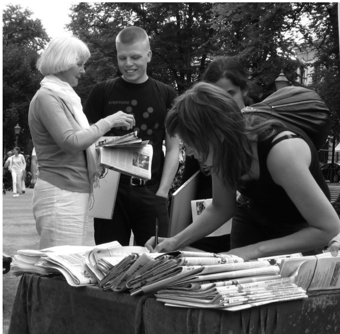
圖：途徑的芬蘭大赦國際的成員，主動來簽名聲援法輪功。