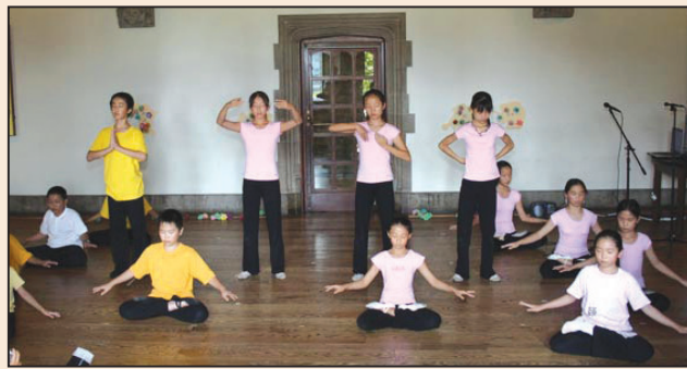
明慧學校夏令營 孩子收穫大(第四版)