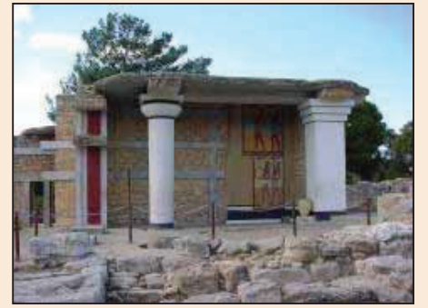
海上霸國消失之謎(第八版)