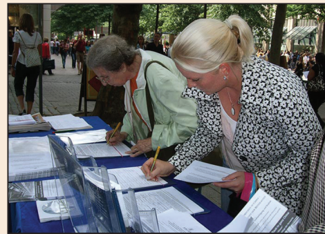
殘酷迫害驚醒德國漢堡人(第六版)