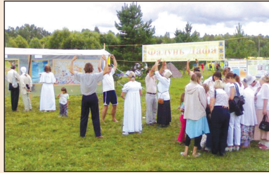
西伯利亞豐收節講真相 (第四版)