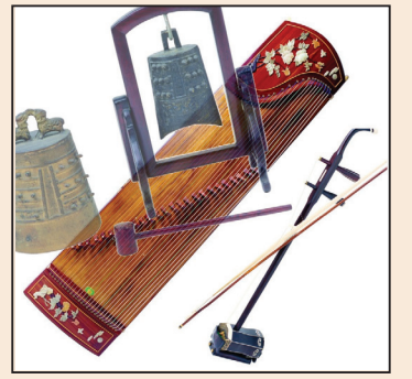
「中國元素」與「中國文化」 (第三版)