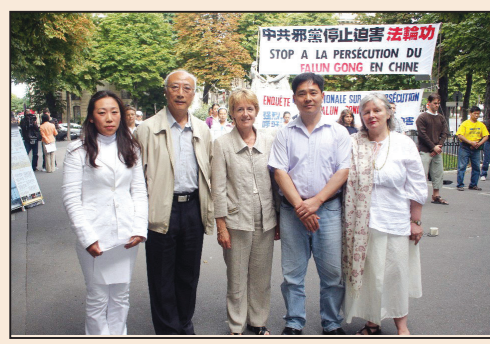
巴黎新聞發佈會 聚焦法輪功 (第七版)