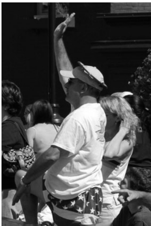
熱情的觀眾學煉法輪功第三套功法