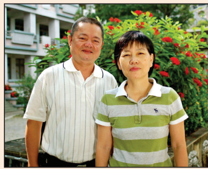
昔日酒醉賭博客 今朝體貼好丈夫 (第四版)