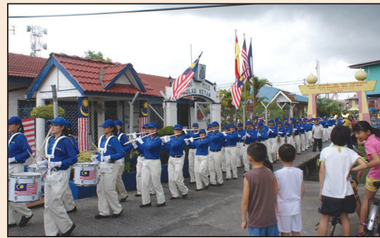
馬來西亞國慶日 天國樂團亮相吉膽島 (第七版)