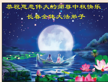
大陸大法弟子中秋節問候師尊 (第四版)