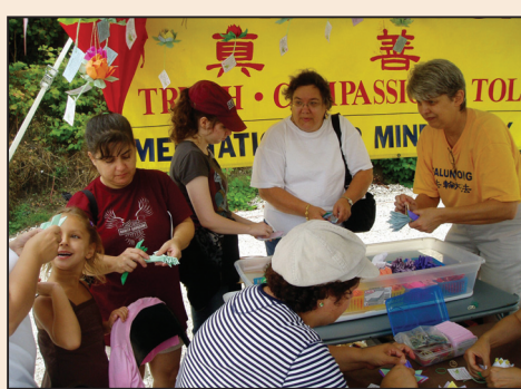
美國羅德島州龍舟賽 蓮花傳真相 (第七版)