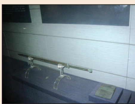
現代物質科技與古代精神科技 (一) (第八版)