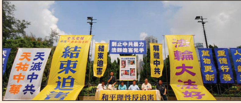
香港集會遊行 呼籲制止中共暴力 (第七版)