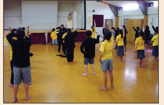
新西蘭法輪功學員應邀到小學教功 (第四版)