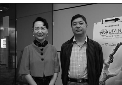
加拿大知名作家、詩人盛雪與自由撰稿人劉軒

須寅強調，中共的本性就是欺騙。他還舉例，最近波及世界的毒奶粉事件，其實中共早就知道毒奶粉，它就是為了奧運極力掩蓋著；現在此危害已經波及全球；所以國際上各界人士都應該出來揭露和譴責中共的罪惡。