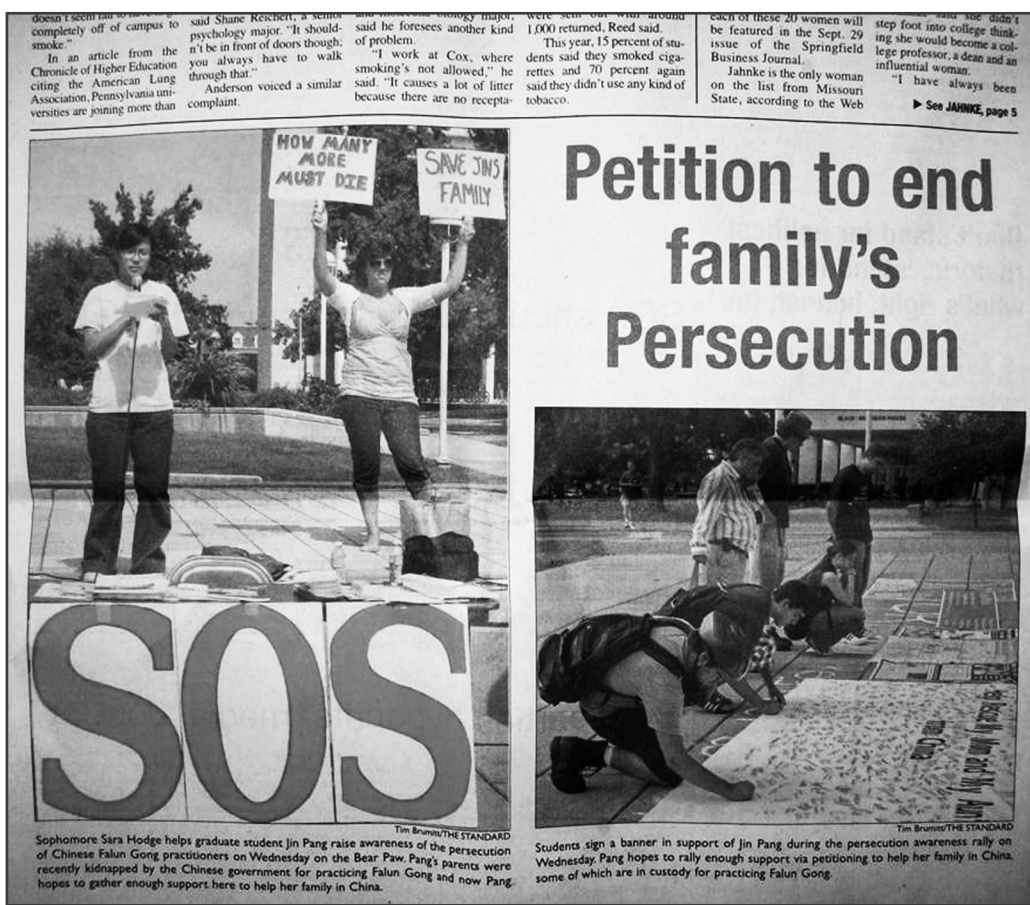
圖：校報 The-Standard 再次登載大幅照片

幾乎每一個路過的老師和學生都當場簽名表示聲援營救和譴責迫害。當路過的同學和老師們看到中共酷刑折磨法輪功學員的照片的時候，大家都非常震驚這些暴行竟然發生在當今的社會裏。他們說，真的難以想像一群和平的人，僅僅因為追求自己的信仰就要受到這種非人的待遇，美國民眾和美國政府必須一同來關注這件事情。