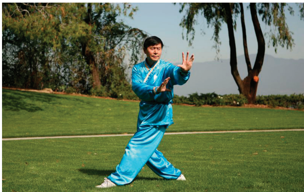
「全世界華人武術大賽」評委主席李有甫

李有甫今年六十歲，自十二歲開始習武，是中國武術名家陳盛甫、陳濟生的高徒。他既有武術功底和氣功功能，又有理論研究功底，後來更成為中國中醫和氣功領域中的知名人物。