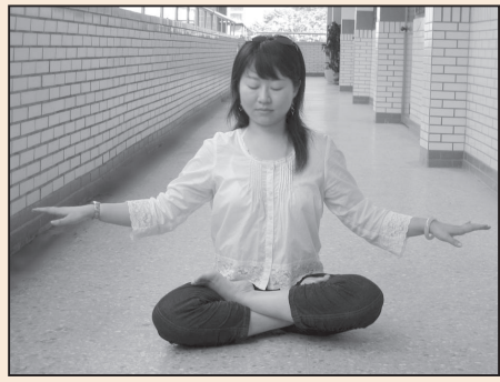
找到真正回家的路(第四版)