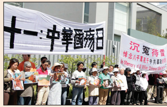
悉尼聲援四千三百萬中國人脫離中共(第七版)