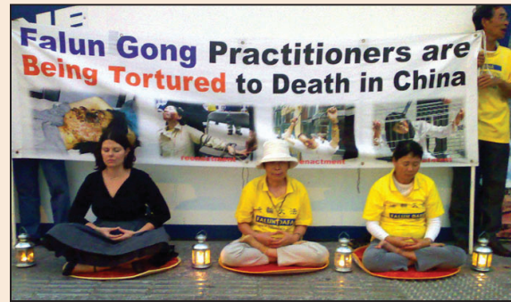
澳洲昆省法輪功學員抗議中共暴行 (第六版)