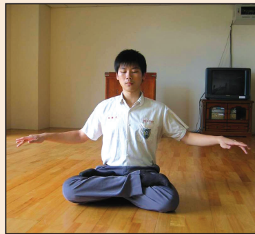
告別憂鬱年少 (第四版)