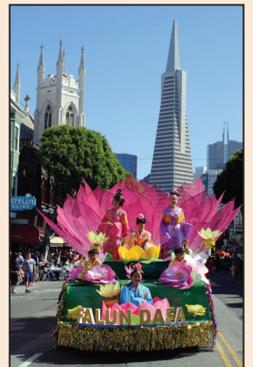
法輪功參加舊金山哥倫布日遊行 (第七版)