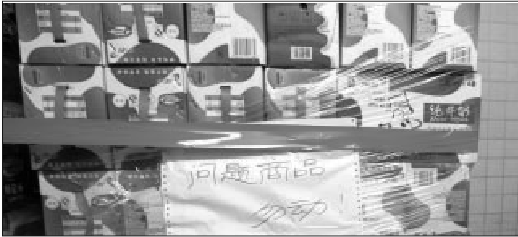
九月十九日，吉林省長春市一家沃爾馬超市裡下架的毒奶粉。