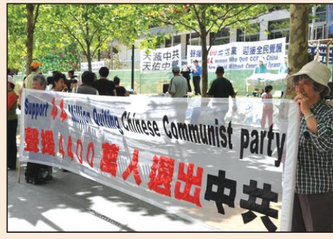
「三退」為國家和民族注入希望 (第三版)