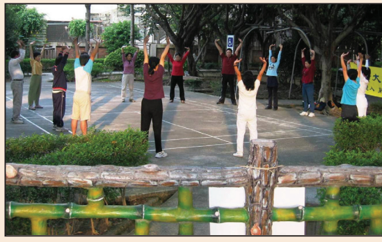
有緣人倆倆相繼而來 (第四版)