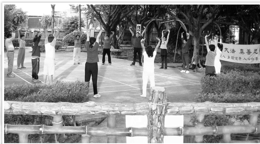
圖:每天集體煉功迎接晨曦，開始美好的一天

還有其它徵兆包括渙散的眼神、蠟黃的氣色也都獲得明顯改變，更重要的是，他已經恢復上班，在此之前，他形同廢人，如