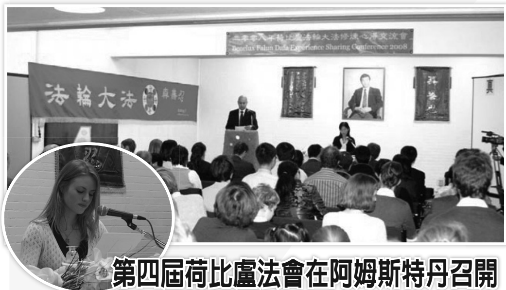
第四屆荷比盧法會在阿姆斯特丹召開

可是這利益心、自私的心有時真的感覺還很深的，總覺得去不淨。在幾天前，丈夫用我的車，我心想他用完我的車，一定會把油加滿的，因為那是他跑的不是我用的，加油也是應該的。可是丈夫用完車後，我一看他沒有給我車加油，心裏就不高興了，我花錢加油你用完了也不給我加滿，這時說話也沒好氣兒了，他還不知道我為什麼生氣。沒過幾分鐘，我馬上意識到這不對，這是自私的心、利益心，這不是我，我不要它，要去掉它。心情馬上就好了。