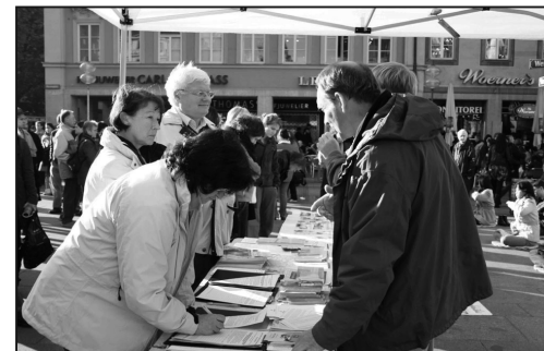
人們爭相簽名聲援法輪功反迫害

週末的瑪琳廣場 (市政廳廣場) 一向是人山人海。悠揚的音樂伴隨著法輪功學員安詳的煉