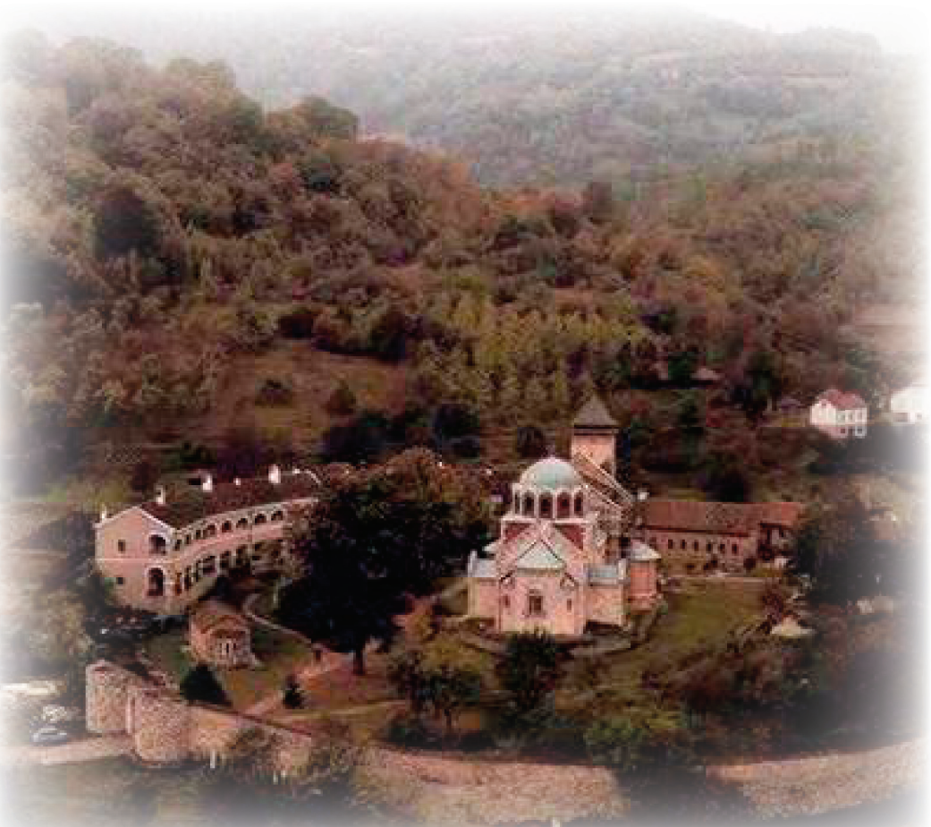
您知道嗎？宗教修煉等靈修活動的精神力量，可能戰勝老人失智症呢！

除了飲食、起居規律外，一大原因可能是她們思想純淨、信仰堅定、並且專心一意的禱告。人和動物的區別就在於人特有的精神，但是幾乎在所有的生命科學研究裡，都只注重組成人體的物質因素，比如基因、蛋白質等等，而人的精神因素則完全被忽略。隨著越來越多不符合科學邏輯現象的出現，我們是不是應該認識到，當我們在探究生命奧秘的時候，人的精神層面確實是不可迴避的部份。