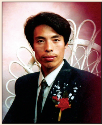
大學教師在冀東監獄遭迫害(第一版)