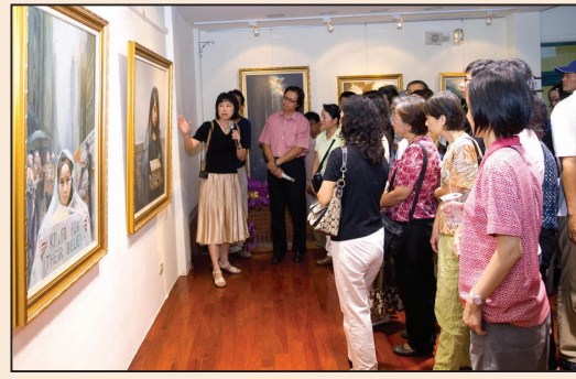
台北真善忍美展(第七版)