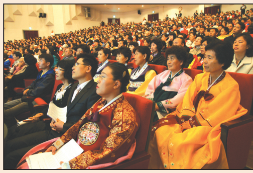
法輪大法亞洲法會在韓國隆重召開(第四版)