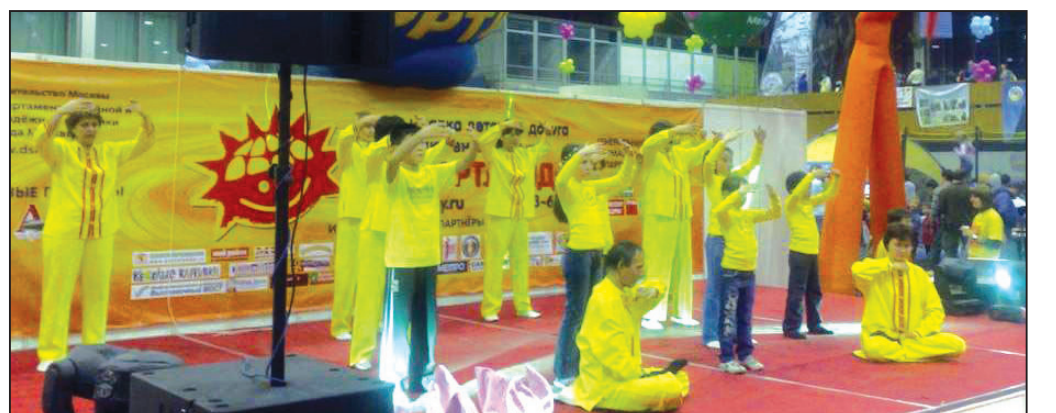
處，幾乎人手一份法輪大法真相資料。面對心存「真善忍」的大