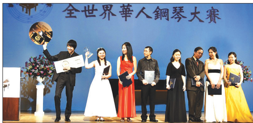
首屆全世界華人鋼琴大賽落幕獲獎選手

以透露選手的內心世界。「成功的鋼琴演奏者除了能掌握作品的風格，清晰地構畫出作曲家對作品的構思，最重要的就是能打動人，這是公認的標準。」