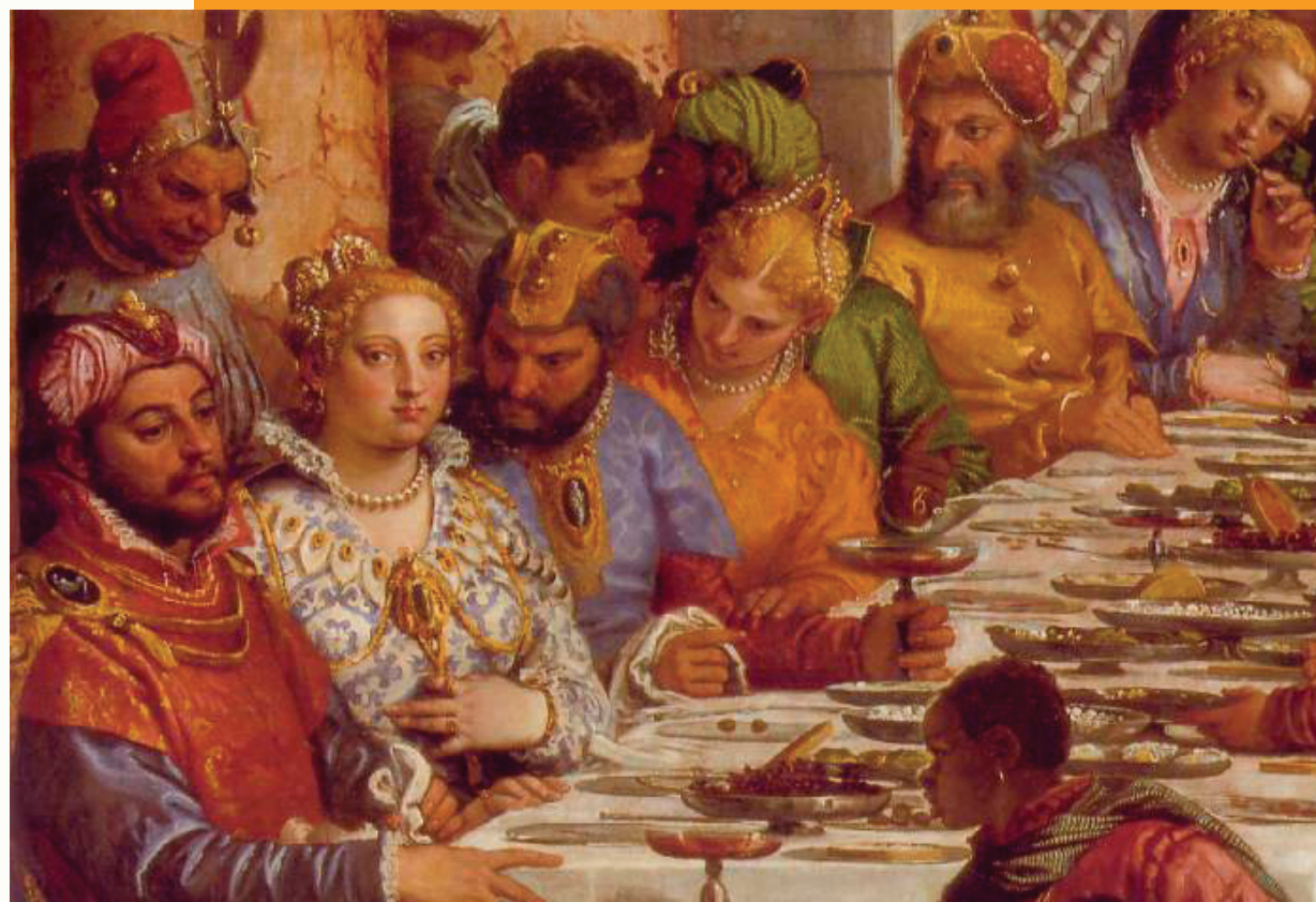
維羅內塞《伽那的婚宴》局部

這幅尺寸達666 x 990厘米的巨型油畫建築壯麗輝煌，人物衣著豪華，場面闊達和獨創性的細節描繪令無數人為之傾心。夢想般奢華的宮殿，放射著光芒的基督耶穌和聖母瑪麗亞端坐於整幅畫的中心，宮殿裡雲集了一共132位客人與時賢名流。畫中一共132位栩栩如生的人物，大家表情各異，而畫裡面身著艷麗服色的音樂家們，是當時威尼斯那些最為著名的畫家的真實肖像，包括維羅內塞本人和他的好友們：畫家提香、巴薩諾、丁托列托和作家阿雷蒂諾。真實與超凡並存，現實和神聖同在。（正見網）