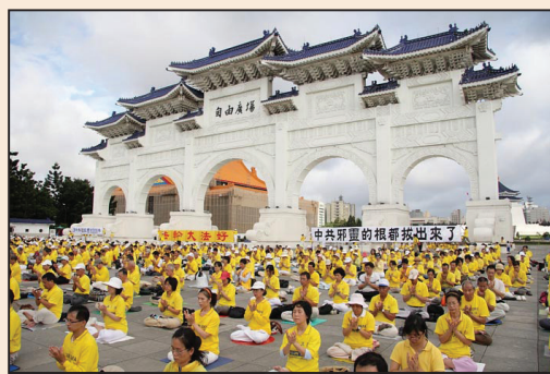
三千台灣法輪功學員呼籲結束中共迫害 (第七版)