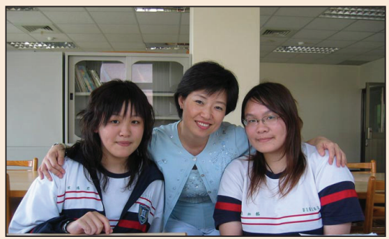
從敬陪末座到名列前茅 (第四版)