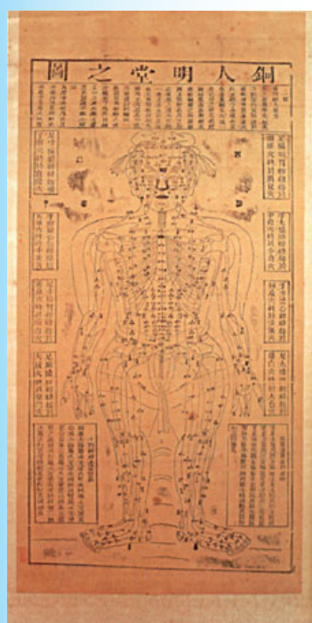
大福明堂圖繪刻 （《中國醫學通史圖譜卷》）