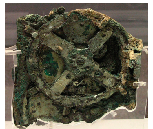
公元前二世紀的天文儀器 (Antikythera Mechanism)

看來人類歷史發展進程並非如我們原先想像的那樣直線式的演進。其實許多大膽的學者已經提出了文明發展循環學說，並且根據考古資料證實了史前文明的存在及其毀滅。或許，我們對人類歷史的認識，才剛剛開始。