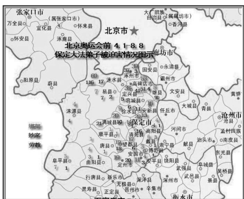
詳盡案例彙編，請參見 http://www.minghui.org/mh/articles/2008/11/20/190108p.html 文中的鏈接。