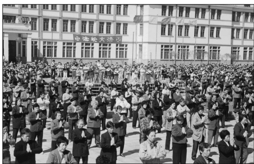
佳木斯市政廣場集體洪法煉功（1998年拍攝）