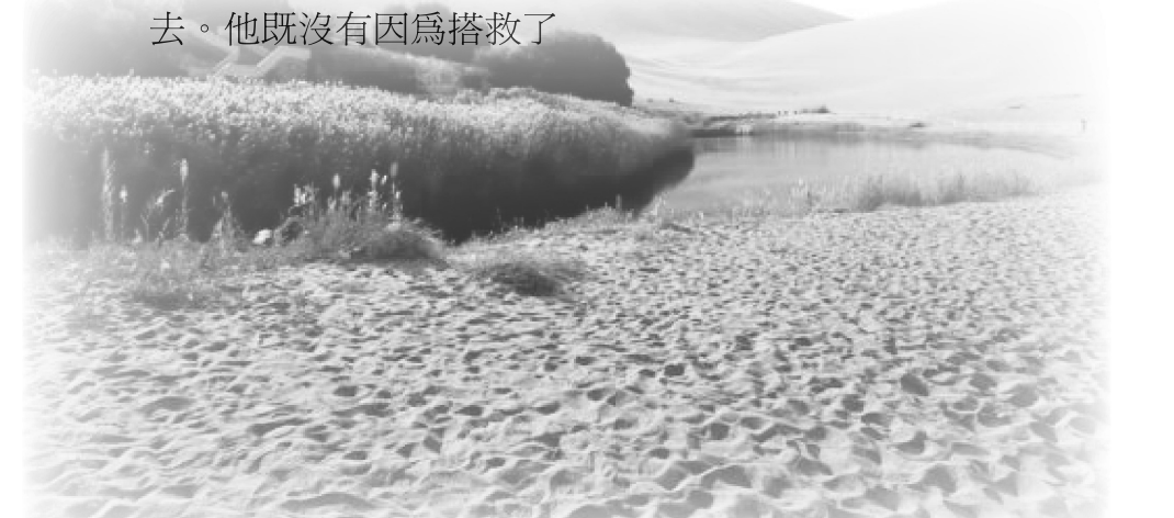
神奇的袋子、救命的真言就如荒漠甘泉

天象大變，人間將發生大事。大法弟子甘冒牢獄、酷刑的危險告訴世人：天滅中共、退黨保平安。神奇的袋子、救命的真言就如荒漠甘泉，但信與不信全在自己。