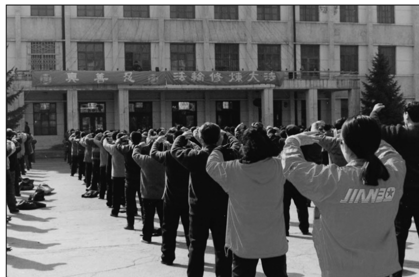
佳木斯大學煉功點