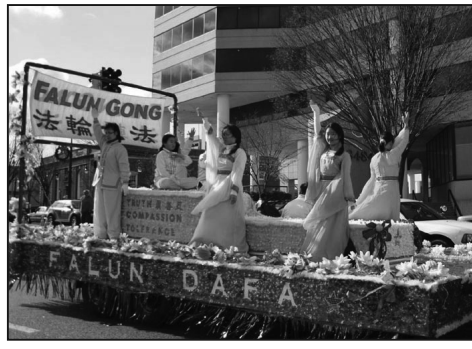
當地最大報《巴爾的摩太陽報》做了特別報導。

表演隊和舞龍隊的表演讓人們感受到節日的歡樂，有些人模仿著學員的煉功動作，還有很多人爭相拍照留念。華盛頓首家、也是唯一一家全天二十四小時播出的地方有線新聞台——新聞八頻道，現場全程直播了兩小時的遊行。法輪功學員組成的腰鼓隊成爲今年巴爾地摩感恩節遊行的一個亮點，他們不但受到沿途觀看遊行的各族裔民眾的歡迎，而且還被