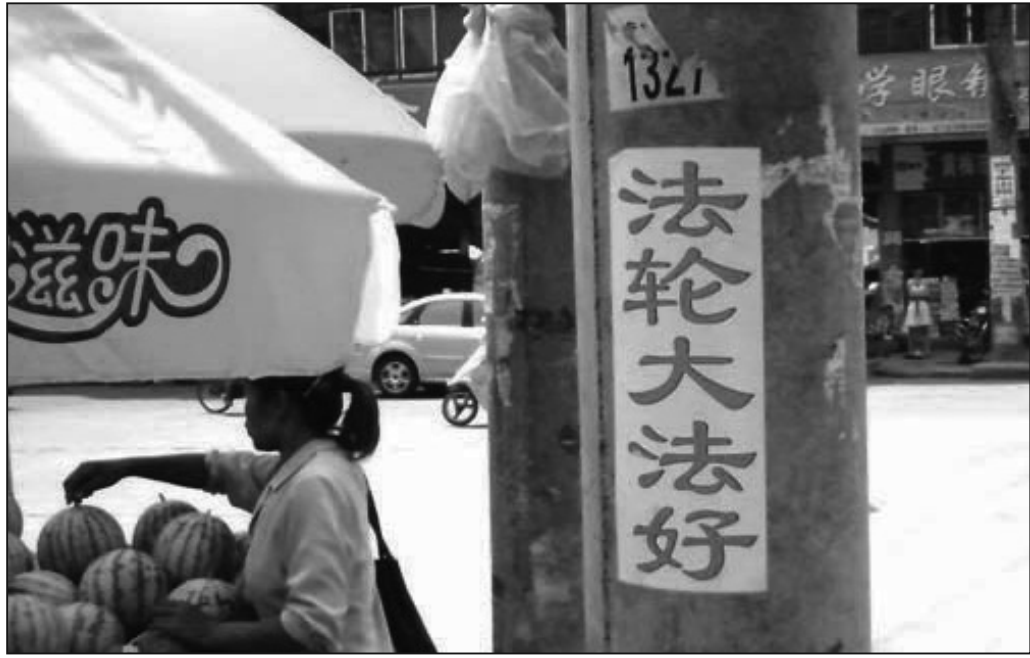
大陸湖北黃梅縣街頭標語「法輪大法好」

在「信仰法輪大法合法」的法律依據方面，《世界人權宣言》第十八條說：人人有思想、良心與宗教自由的權利。《公民權利和政治權利國際公約》第十八條說：人人有權享受思想、良心和宗教自由。中國憲法第三十六條也有關於宗教信仰自由的規定。不過，中國憲法的這些