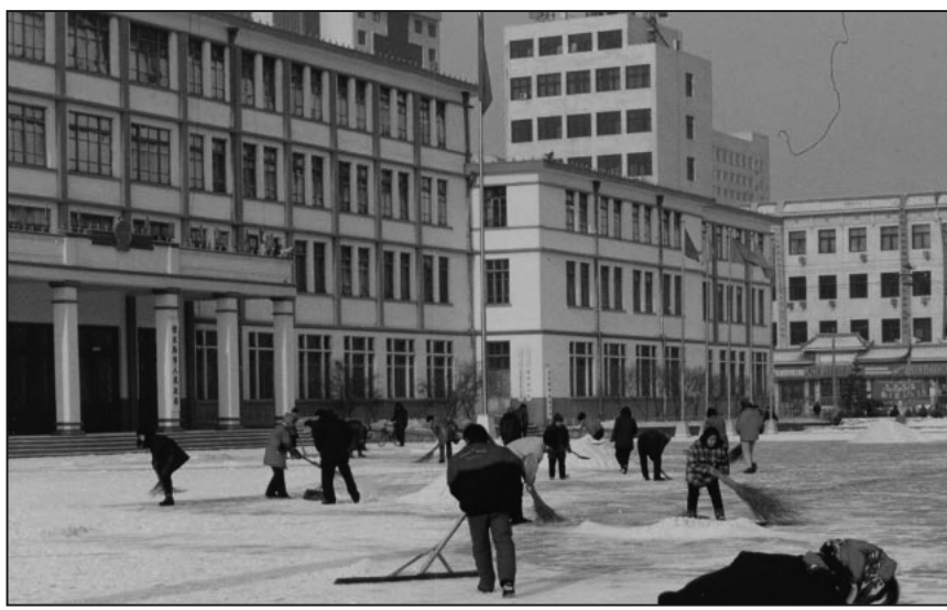
每逢下雪時政府廣場煉功點的大法弟子都早早把新雪打掃乾淨，此舉曾受到當時的市長褒獎，並將消息刊登在當地報紙《三江晚報》上，佳木斯電視台也報導了此事。