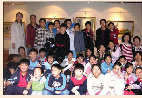
台灣各界人士盛讚真善忍美展 (第七版)