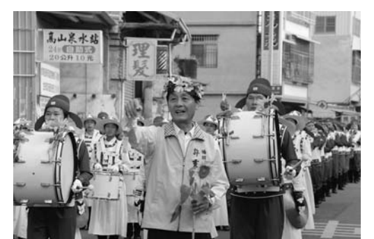
许乡长招呼乡公所官员来和天国乐团合照

的蔗糖博物馆。高雄县发展一乡一特色，桥头乡以发展花卉成为当地的特色。游行结束后，许乡长颁赠感谢状，感谢法轮功对社区的贡献。