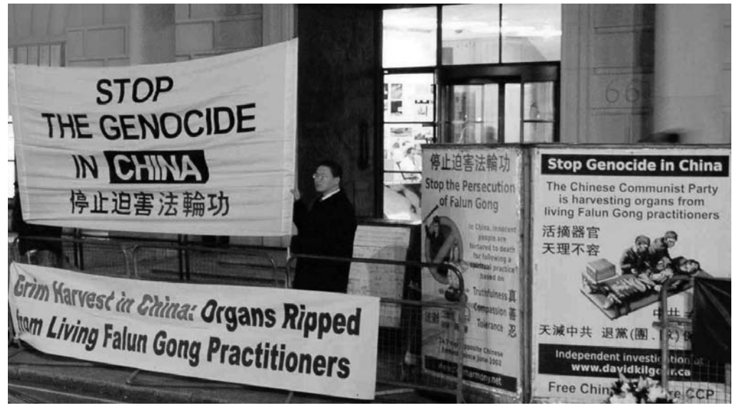
在伦敦中使馆前抗议中共迫害

澳洲悉尼部份法轮功学员在繁华的Town Hill市政厅广场举行集会，揭露中共政权九年来对广大修炼“真、善、忍”的法轮功学员所犯下的群体灭绝罪行。