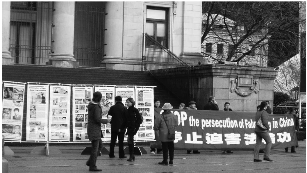
在艺术馆前征签、打横幅，呼吁制止迫害

夜，一天二十四小时，在中领馆前坚持抗议七年多了。但是他们并不孤立，许许多多正义的加拿大人和他们站在一起。