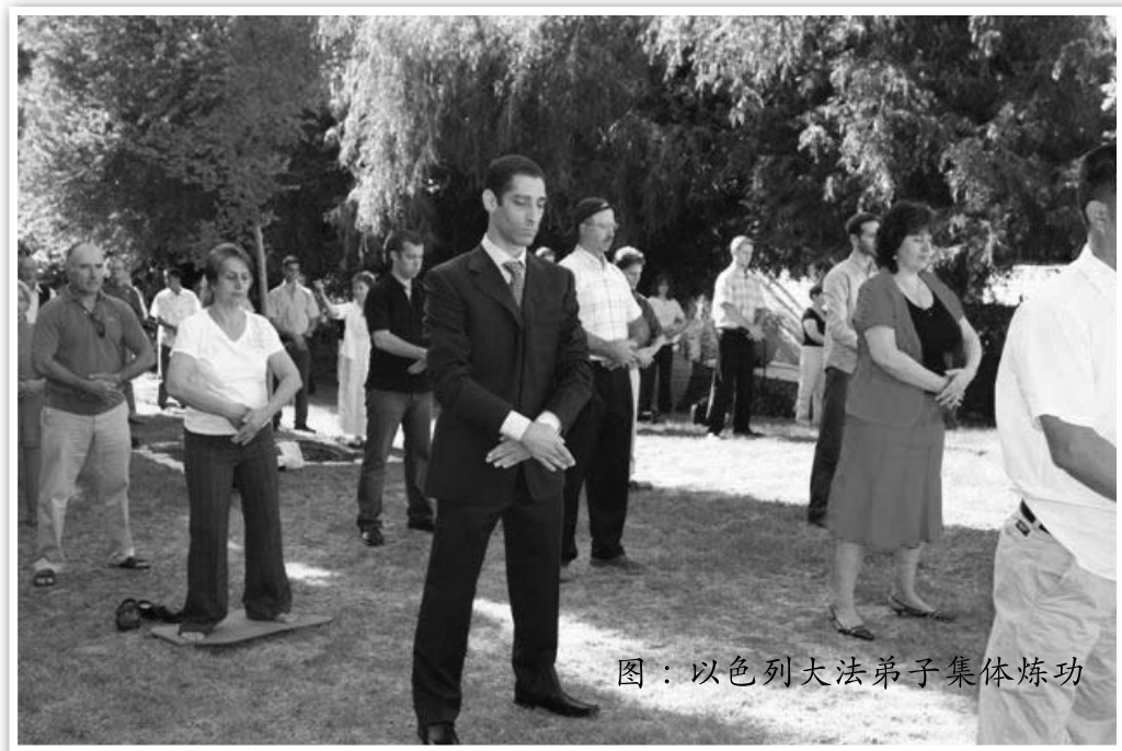
图：以色列大法弟子集体炼功