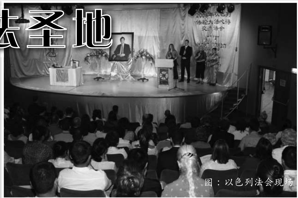
图：以色列法会现场

人世间有些事情不知是缘份没到，还是上苍早已另有安排，奇怪的事情在我身上发生了。得法前的一天晚上，我做了一个奇怪的梦，梦中有人拉我上了一个正在飞行的轮盘上，轮盘上坐着一些人（有亚洲人，也有欧洲人