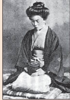
日本明治时代的特异 功能女子(第八版)