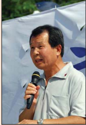
一位台湾法官的修 炼故事(第四版)