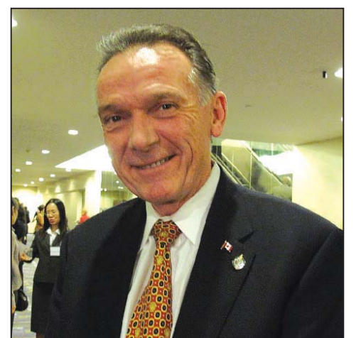
图：加拿大国会议员、美洲司司长彼得·肯特

国会议员瑞兹·纽科斯基称赞神韵纽约艺术团的表演是文化盛宴，让人从精神上获益，受到鼓舞。他说，节目使人从每一个苦难中看到希望。他希望加拿大众议院的同事们能来观看神韵晚会。