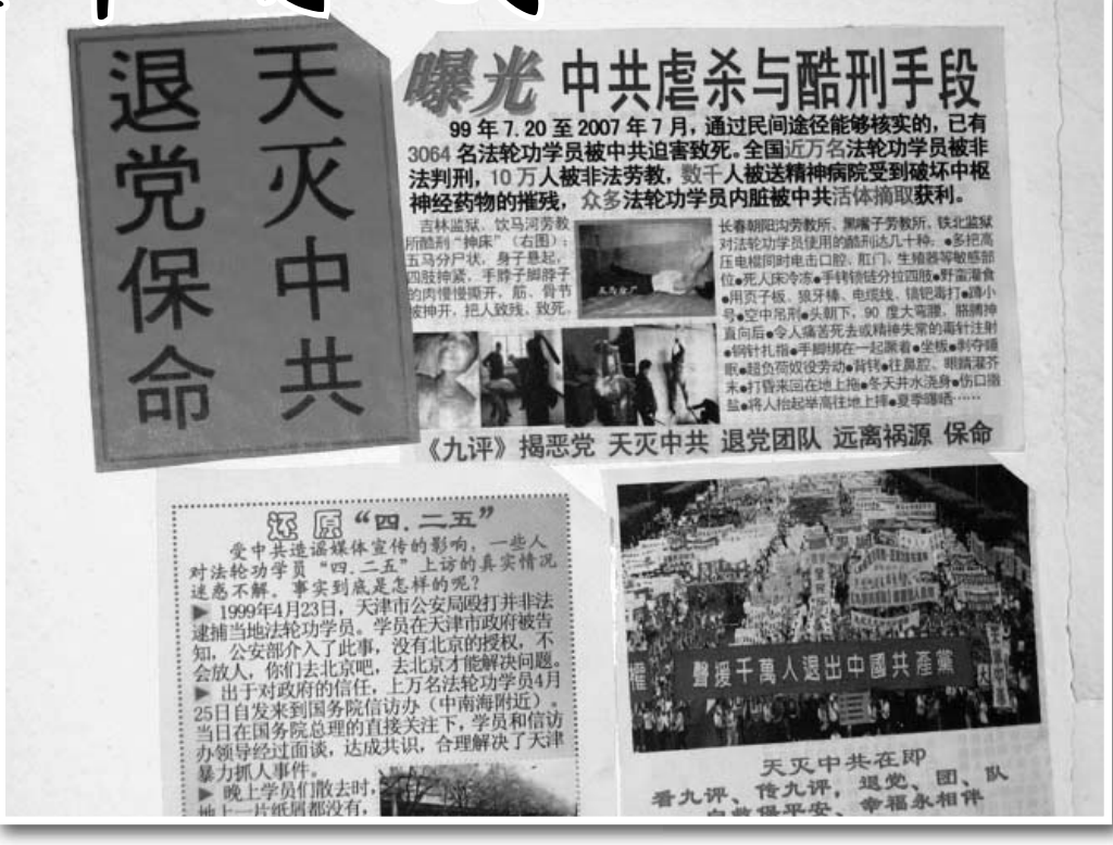
图：越来越多的法轮功弟子们走出来了揭露迫害，劝三退（退出中共党、团、队），图为北京北京小区内的真相资料

几乎所有的交流文章，我都看。看了，让笔者对这些坚韧不拔的法轮功学员肃然起敬。看了让我感受到中共之灭亡的可能性。现在，中共还在嚣张，还在狂妄，但已经受到了最善良最不想闹事的法轮功学员们的致命打击。当然法轮功学员的致命武器是道德。谁也想不到，人类发展