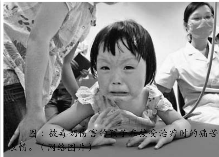
图：被毒奶伤害的孩子在接受治疗时的痛苦表情。

毒奶粉事件曝光后，许多家长纷纷找到商家要求退货，众多毒奶患儿的家长希望通过法律途径索赔。但是中共以一贯的作风把受害人视为威胁其独裁的不稳定因素，9月当许多贵阳受害人来到贵阳市正新街要求退三元奶粉时，被贵阳云岩公安分局以“不法分子”“扰乱社会治安”为由拘留了其中三人。事发至今中共一直都在拖延赔偿各地毒奶患儿家。患儿家长们纷纷来到北京向当局呼吁，自发组织记者招待会呼吁世界关注，可是在记者会召开前，多人却遭到中共的扣押和威胁。中国各地的一批律师自发组成志愿律师团，免费为患儿家庭提供法律咨询等帮助。但律师们帮助受害者的维权努力一直受到中共的阻挠，20%的律师迫于压力退出了毒奶志愿律师团。中共能为“和谐奥运”的开幕式花掉3