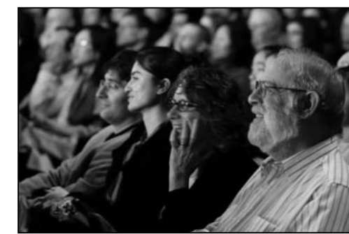
图：神韵西雅图晚会的观众

置，能非常清楚看到乐池内，演奏家们的演奏。对此他特别高兴。他留意到有的演奏家同时演奏不同的乐器，而且中间过程显得如此轻松自如。