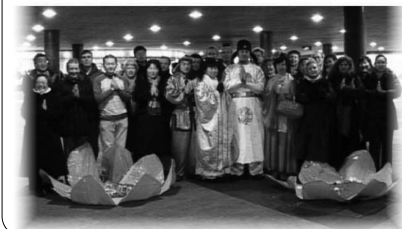
瑞典大法弟子祝愿伟大的师尊新年好！