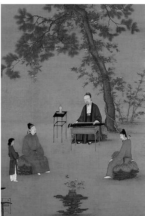
文 / 智真

中国的古琴不仅是一种演奏音乐的乐器，而且有着悠久的历史传承和丰富深厚的文化内涵。中国古代的文人士大夫把琴视为修身、齐家、治国、平天下的理想代言人，甚至视为文人的一种象征。《礼记》上说：“士无故不撤琴瑟”。孔子也说过：“兴