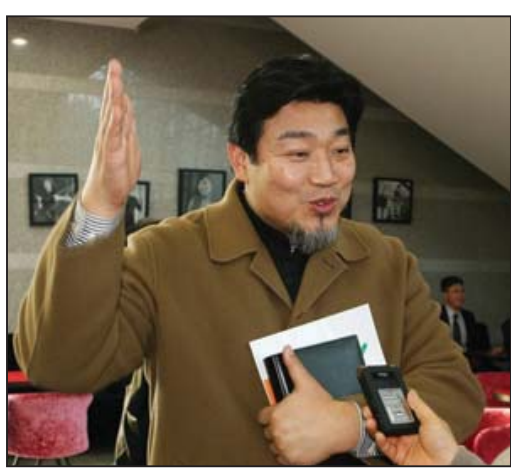
图：舞蹈界顶级权威朴载槿

情况下，弘扬中华传统文化的神韵艺术团所到之处，仍在各地掀起热潮，受到各界的高度赞誉，对此，朴载槿语重心长的表示：“虽然现在经济不景气，但真正出色的演出是不会受到经济危机影响的，神韵演出正说明了这一点。”