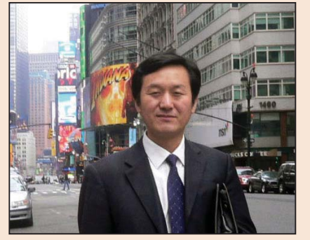
神韵给人绝美的艺术享受与生命的启迪 (第八版)