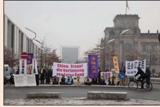
温家宝访德 法轮功要求法办迫害元凶 (第六版)