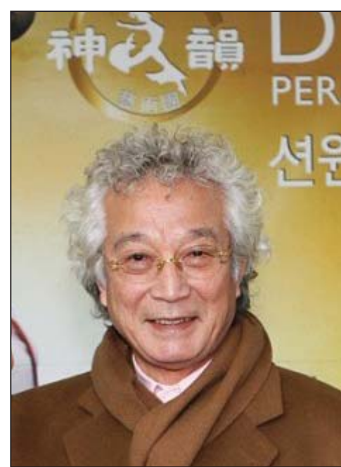
图：六、七十年代韩国最有名的电影演员姜申星

事长、会长、电影导演和制片人。二零零零年当选为国会议员，同时跻身于政界和文化界。他表示神韵演出「实在太美了」。