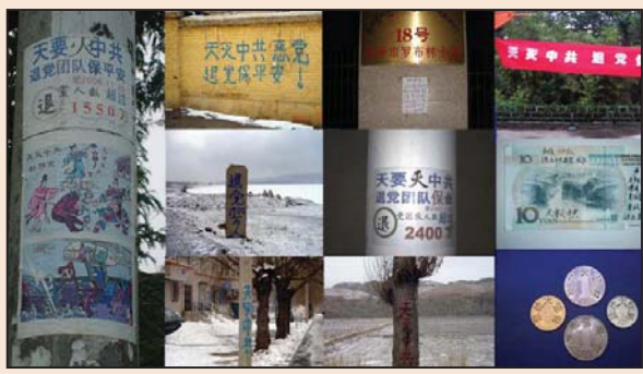
三十六计“退”为上策 (第三版)