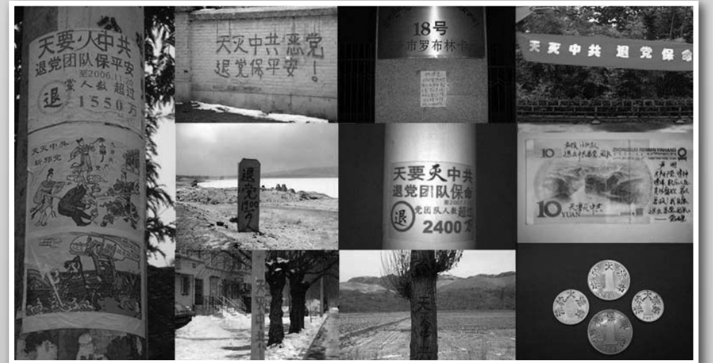
图：中国大陆退党标语集锦

昔者，《兵法》有云：三十六计，走为上策；今者，三十六计，“退”为上策！三退可保平安，如若想拥有一个美好的未来，不仅有上策，还有万全之策，那就是真心向善，记住“法轮大法好！”