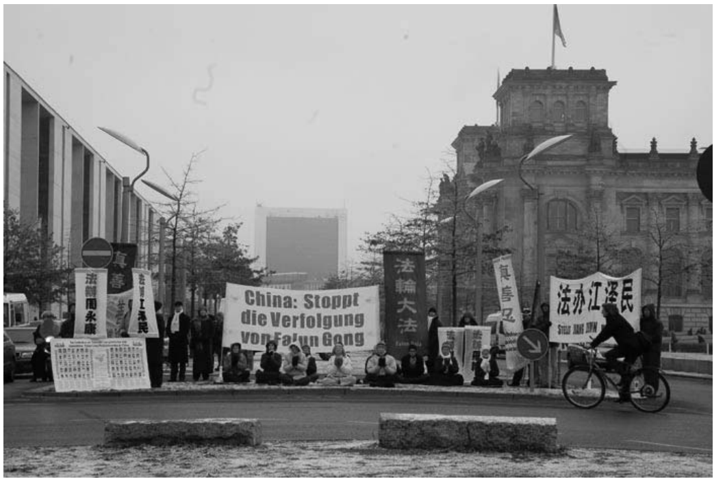
德国总理府前法轮功学员抗议中共迫害法轮功