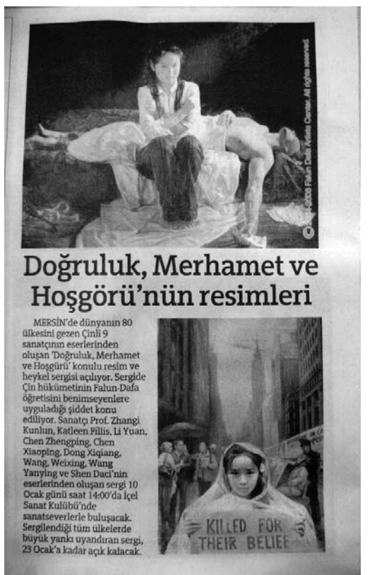
《自由报》率先刊登美展消息

《新闻网》（Haber.vg）在刊登的题为《国际艺术画展》的文章中说，“这次美展中的作品是由一群卓有成就的艺术家创作的。这些艺术家通过修炼法轮大法，得到了身心的健康与精神的升华，进一步领悟了宇宙人生的