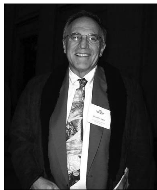
图：汉姆兰大学历史系教授理查德·可根

神韵巡回艺术团一月三十一日在丹佛市中心的布尔剧院 (Buell Theatre) 继续上演了两场演出，受到科罗拉多州政界、学术界、艺术界、商界、华人等各方的好评及