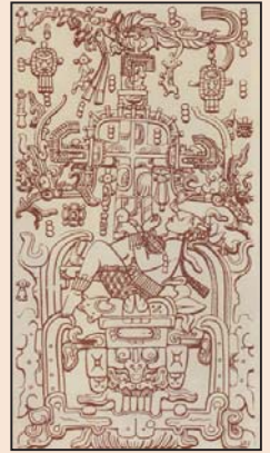
开着宇宙飞行器的玛雅人为何消失了? (第八版)