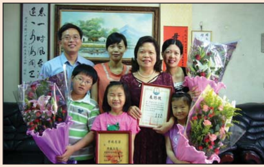
获颁模范母亲 最感谢李老师 (第四版)