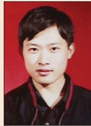
团圆节 辛酸泪 (第六版)