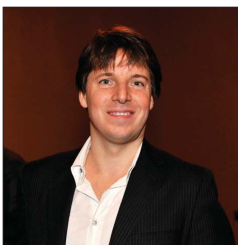
图：世界顶级小提琴家贝尔先生

美国首都及邻州各级政要向神韵艺术团颁发褒奖，祝贺演出成功。民主党全国委员会主席、维吉尼亚州州长蒂莫西·凯