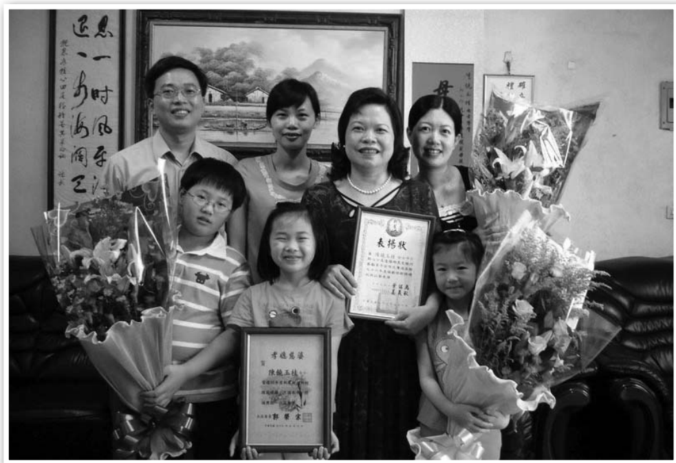
图：获奖的玉桂阿姨和儿女、媳妇，孙子合影