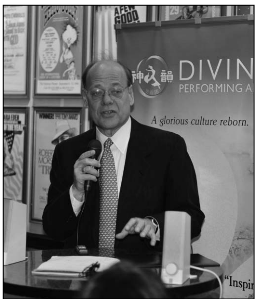
图：美国国会议员斯蒂夫·科恩

二月六日晚间，神韵巡回艺术团在阿拉巴马州的亨茨维尔（Huntsville）的冯布朗中心（Von Braun Center）音乐厅演出，国会众议员Mike Ball表示：“节目精彩极了，非常独特，你