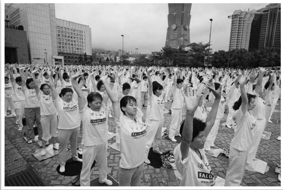
二零零六年五月十三日，台北市政府前，千人炼功庆祝「五一三世界法轮大法日」。