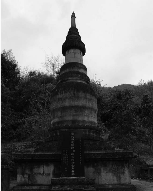
悟达国师就在九陇山修行，从此不再出山。图为四川彭州九陇山唐代悟达国师舍利塔。

地，醒来后，发觉人面疮已经不见了，回头看那金碧辉煌的大殿，也已杳然无踪，后来悟达国师就在那个地方修行，从此不再出山，著名的“三昧水忏”，就是悟达国师后来传下来的。