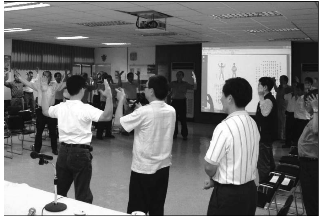
图：现场教练功法，台电员工认真学炼

听完学员见证后，参与的员工相当受触动，非常认真的跟着法轮功学员学习炼功动作。法轮功学员还向参加讲座的员工们讲述了在中国大陆，中共如何残酷迫害法轮功的真相。