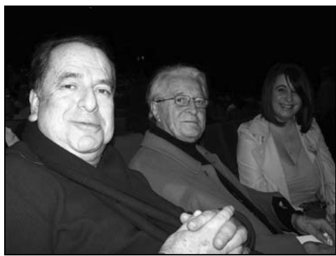
图：世界著名作家、法国国家荣誉勋章获得者保罗·劳卡先生

阿菲德·阿古讷（Hafid Aggoune）是一位青年作家，曾于二零零四年获得费南昂（Fénéon）文学奖。阿古讷先生称神韵把人们带入奇幻的仙境，节目内涵深邃，他感受到了代代传承的中华文化的内在力量，“慈悲、祥和非常强烈的从神韵演出中散发出来，记载在历史的此时此刻，现实和过去形成一体，这才是真正的神奇。这也是我在写作中要做的，一定要把过去的历史告诉未来，所有这一切在演出时都深深打动着我。”