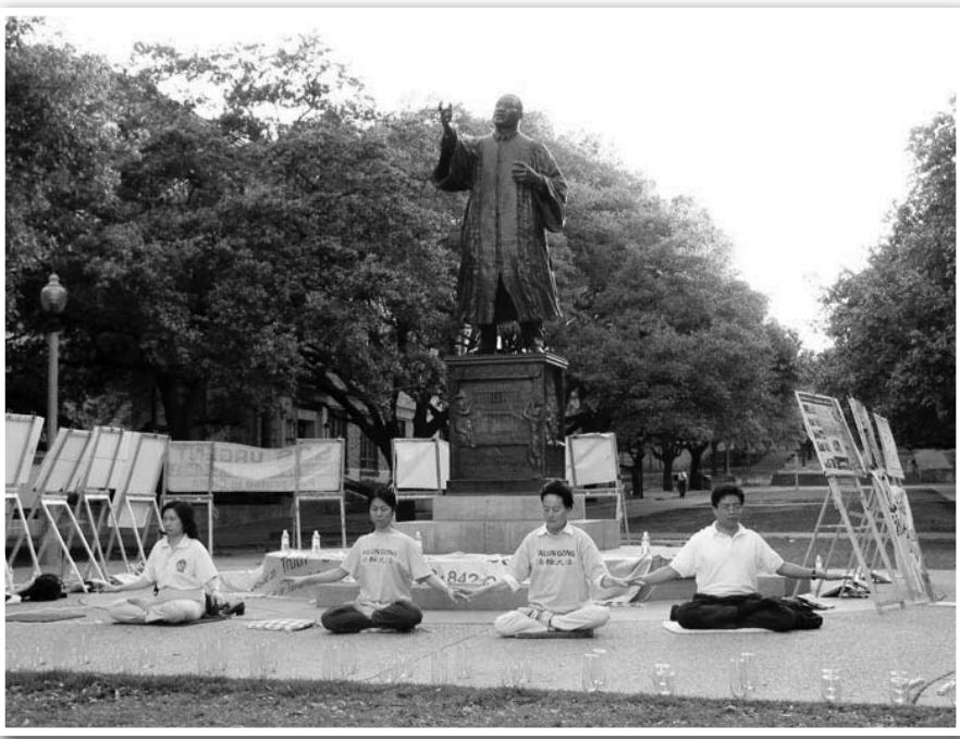
图：美国德州部分大法弟子在马丁路德金雕像前炼功。