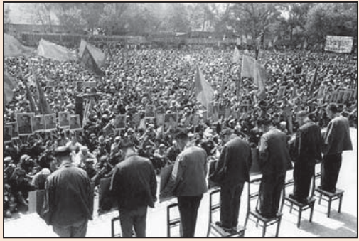
也说凤凰卫视“揭批”的“极端主义”（第三版）