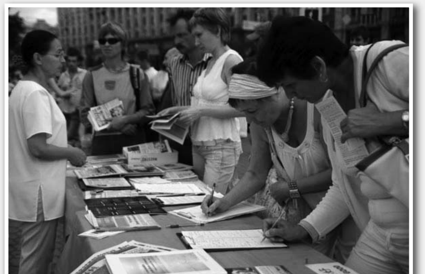
图：法轮功学员在乌克兰举办反酷刑展等活动揭中共的残酷迫害。图为人们签名声援法轮功。

迫害法轮功的元凶江泽民在位时，那种倾举国之力的邪劲都没有把法轮功吓倒。历史走到今天，几个仇视法轮功的跳梁小丑还想助纣为虐，注定要失败的。奉劝凤凰卫视的某些人，为了自己的未来，不要做中共迫害好人的帮凶。