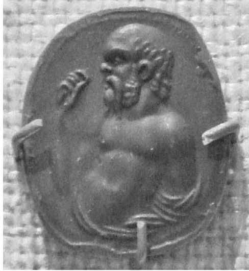
图：公元一世纪的古罗马玛瑙饰品上的苏格拉底

拉底有一句名言：“不经反省的人生是不值得活的！”也就是说，人活着的意义在于自我反省，这个反省是一种道德的反省，因为苏格拉底认为真理能指导人们过善良的生活，而美德是最珍贵的东西。对苏格拉底而言，生命的意义不是对外在事物的执著与追求，而是对内在自我的认识与省察。苏格拉底留给后人的就是一种道德的生活实践，他的哲学对后世影响很大。