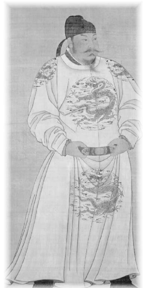
图：中国的唐太宗李世民

“道高益安，势高益危”语出《史记·日者列传》，原文是：“道高易安，势高益危。居赫赫之势，失身且有日矣。”意思是说，道德越高尚，就越能为他人着想，这样的人就越来安全；权势越大，就越容易滥用权力，以权谋私，这样的人就越来危险。道德是一个人的立身之本，纵观古今中外，权大而德之人自能造福于社会。例如中国的唐太宗李世民就是一个有德之君，他以仁政治理国家，从不妄动干戈，使初唐时期的“贞观之治”在文化、经济、农业、手工业、商业、交通等各个方面，都远远的超越了以往的所有时代；唐诗的繁荣，散文的复兴以及传奇文学的成熟，也把人类文学史推上了辉煌灿烂的顶峰。无道的昏君与奸臣则必定危害众生，最终把自己也送上断头台。例如中国古代的邪恶暴君夏桀、商纣王、秦二世、隋炀帝等人都以暴力杀人著称，虽然他们在位时都曾不可一世，然而他们无恶不作之后的下场也几乎都是一样的：夏桀被放逐而