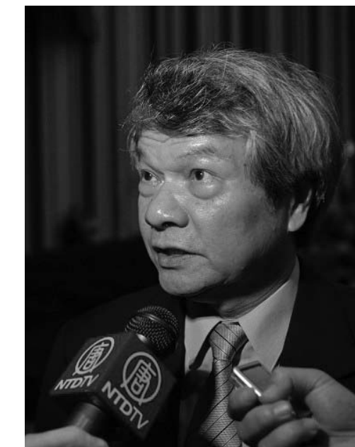
图：立法院最高顾问黄逢时

刘国栋中将，是国防部前军法司司长，和夫人一起观赏了神韵演出，他语带哽咽的表示，从舞蹈肢体语言让人体会五千年文化的博大精深与中国舞蹈的内涵，丰富的程