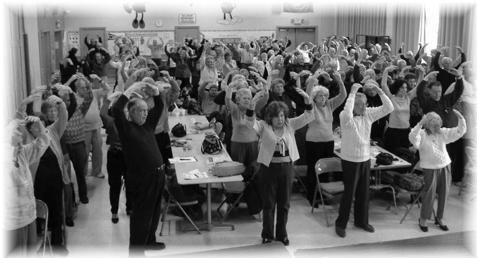
图：纽约长岛PlanView老年人俱乐部成员学炼法轮功