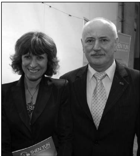
图：波兰罗兹广播电台台长达留士·柴夫柴科与夫人

和阔萨卡女士一同看演出还有约七十位学校的老师和学生。阔萨卡女士认为，神韵演出对学生非常有教育意义，“我想孩子们会对中国、中国的问题和中国文化中精神层面的东西有全新的看法，这是最重要的。这个信息不是通过书本或文字传递的。我认为神韵是现在这个时代里最好的文化、历史和民族之间的交流，是最好的教育方式。”