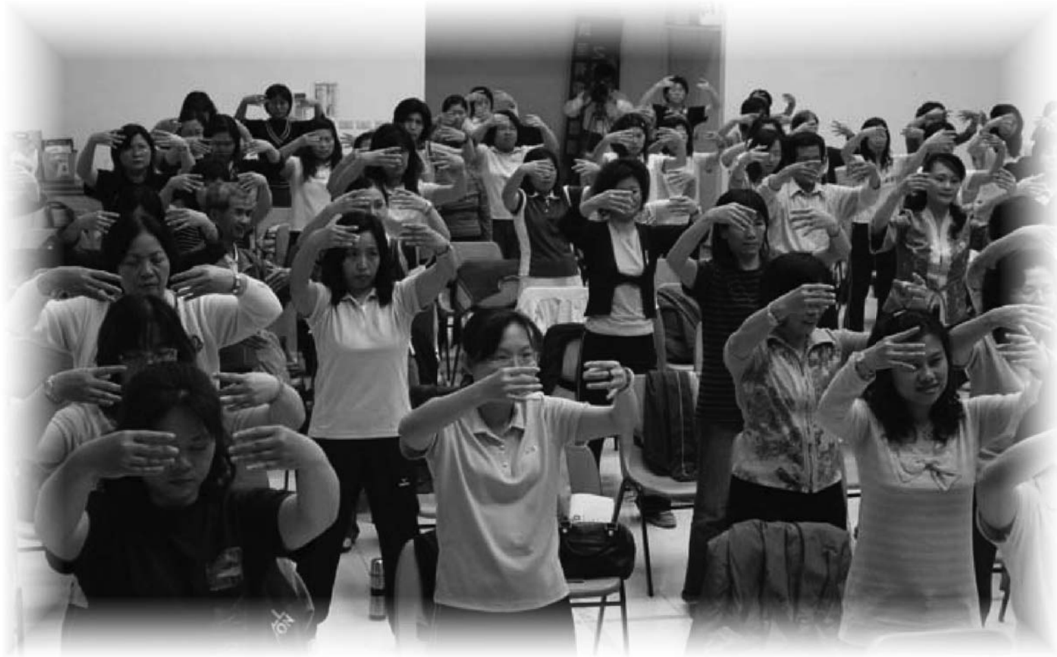
图：近百名台南县卫生局及社会处的研习人员学习法轮功