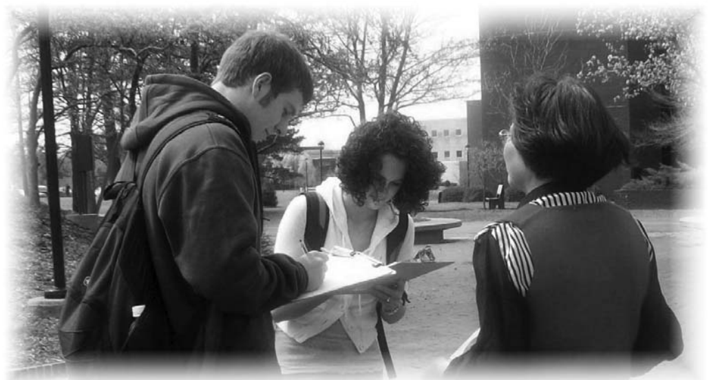
图：南伊利诺伊州大学学生签名呼吁营救在中国被非法关押的法轮功学员

个签名，很多学生主动前来询问并签名，还有的学生回去之后把自己的朋友们带来。一个学生表示说，不敢想象几个月甚至几年都见不到妈妈是何等的感觉，特别是仅仅因为信仰法轮功就被非法关进看守所、劳教所和监狱，是残忍而令人痛心的。