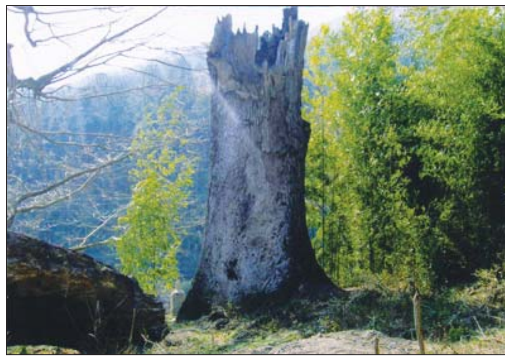
图: 腐败至极、拦腰折断的古枫树左图: 古枫碑记

诸如: 明末的李自成起义、清廷的屠城、八国联军进中国、二次世界大战日本侵华, 文化大革命、非典(萨斯病)等大事发生, 当地人都因这块石头而提前预知了。而这块奇石据讲也是“金口难开”, 每一次事件发生前也只是叫唤那么几次, 而像这几年来都连续不断的鸣叫, 使当地的老人意识到不久的将来, 一定有一件超过历史上所有事件的大事将发生。