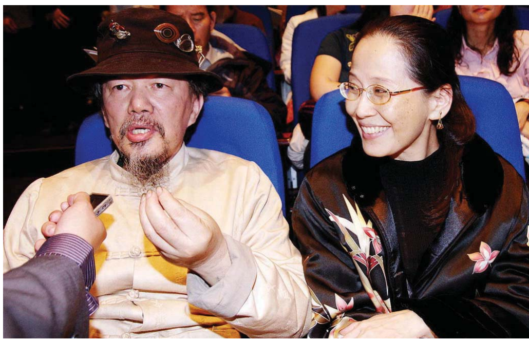
图: 台湾著名漆艺家赖作明先生与夫人