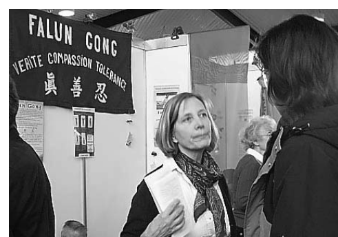
图：人们前来了解法轮功真相

在展览会期间，许多人了解了法轮功真相，想要学法轮功，并询问当地炼功点的信息。人们在了解了中共迫害法轮功的暴行后，谴责中共对法轮功的迫害。