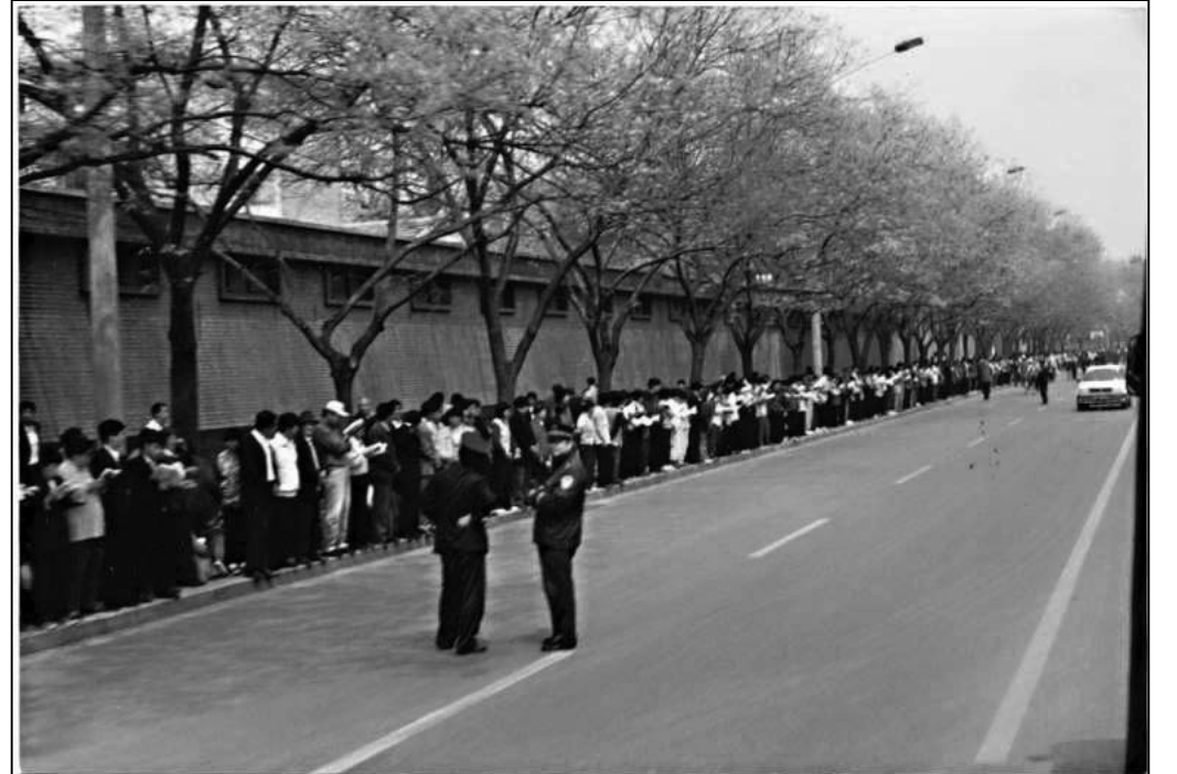
图：1999年4月25日法轮功学员在国务院信访办门外的府右街和平上访

4·25当晚，江泽民出于妒忌，强行把和平上访歪曲成“围攻中南海”，并于1999年7月开始全面迫害法轮功。