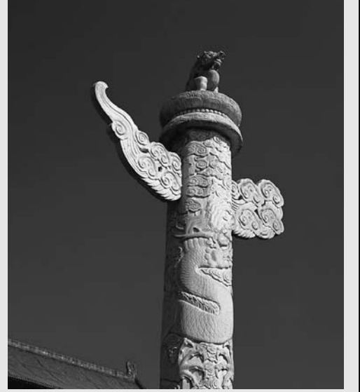
图：今天的天安门华表，就是由古代的谤木演变而来的。

史书上记载：帝尧在位时，虚心听取百姓意见。常常担心处理国事会有什么差错，而百姓又不敢当面直说，特意在宫廷门外设了一面鼓，如果有想要直言进谏的，可以直接击鼓求见。目的是让天下之人都能够说出自己的意见。尧又担心自己在处理国家政事上有什么差错，百姓私下议论，而自己无从知晓，又特意在宫廷门外设立一块木板，让人将朝廷的过失写在上面，这样使天下的百姓都有机会指出帝尧的过错。今天的天安门华表，就是由古代的谤木演变而来的。