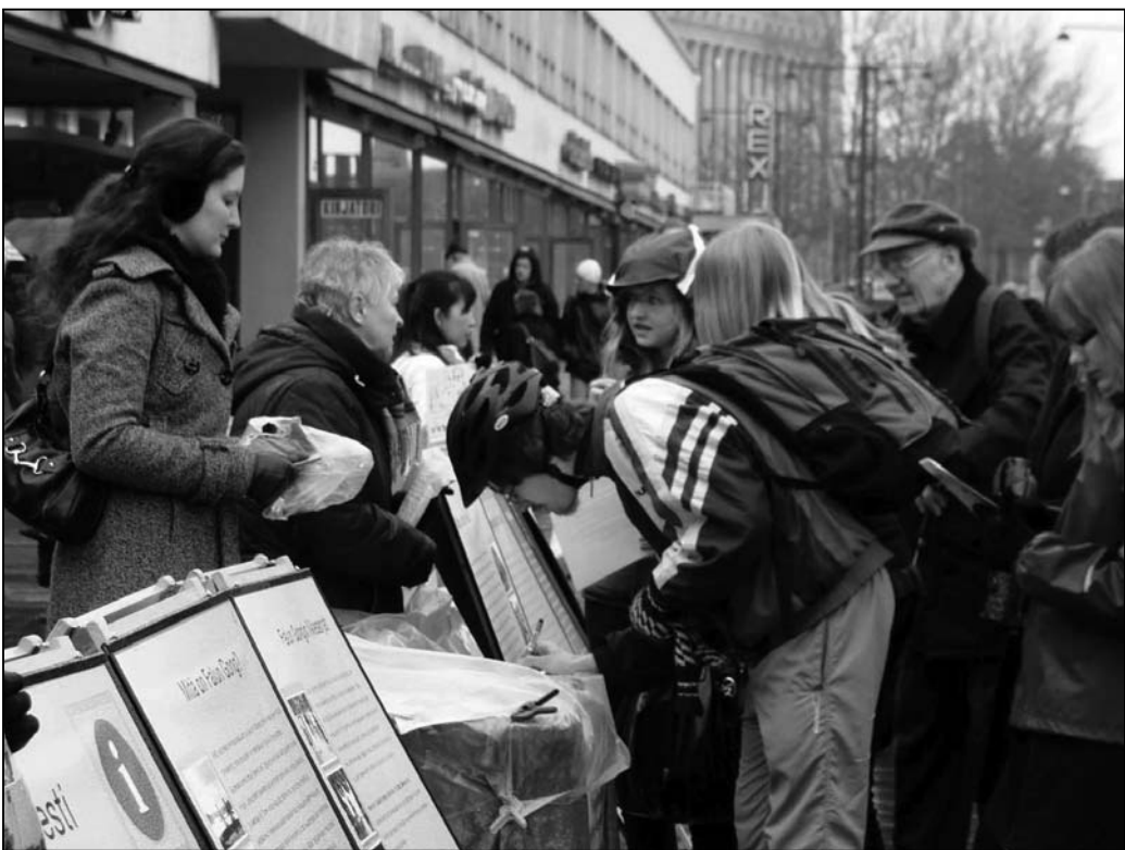
图：芬兰民众排队签名声援法轮功反迫害

整版报道，题为“学生的家人在中国面临迫害”；当地覆盖面最大的电视台KY3专题报道了曹俊萍因为修炼法轮功在奥运期间受迫害的事情。在曹俊萍被绑架一周后，美国众议院议员瑞伊·布朗特特意就此事写信给中国驻美国大使周文重，要求当局关注曹俊萍的事情，并希望“尽其所能确保曹俊萍尽快被释放”。