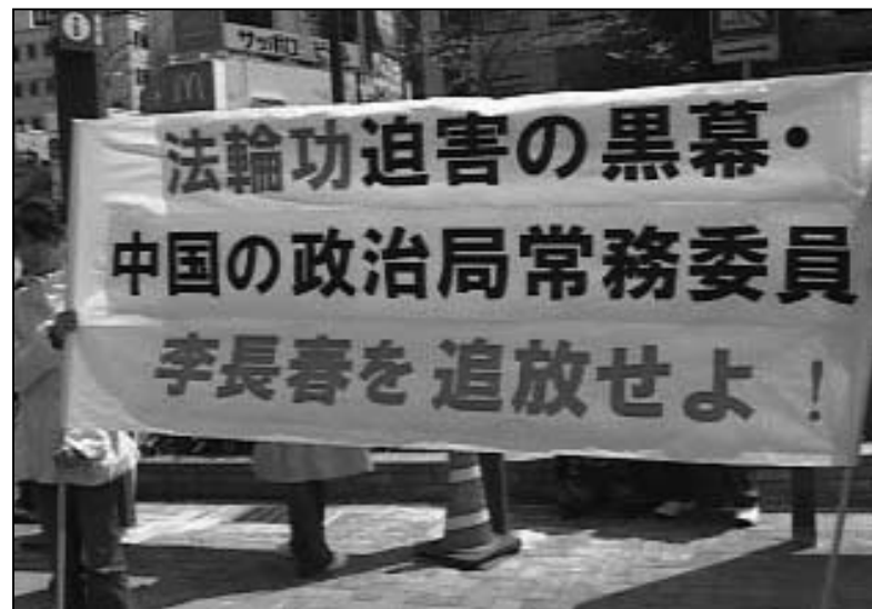
图：日本神户元町车站前的横幅

四日至七日，李长春一行访问韩国，在济州汉拿大学孔子学院、西归浦徐福公园等地也处处受到抗议。李长春为躲避抗议声潮，偷偷从后门出入。