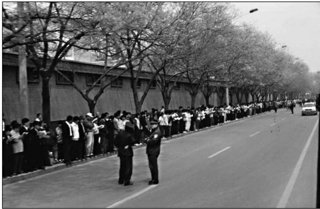
图：秩序井然的425上访人群

消息传到北京，当时北京的许多法轮大法学员，包括当时北京的原法轮大法研究会负责人决定4月25日去国家信访局上访。得知这一行动的外地法轮功学员也相互联络，结果那天紧邻中南海的国家信访局外请愿人群达到一万余人，这就是震惊中外的“四·二五事件”。