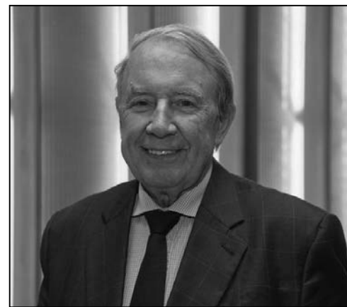
图：现任布鲁塞尔议会议员乔斯·卡波特

明了中国的传统文化富有内涵，“（晚会上的）歌曲的歌词都很美，非常好，含义很深”。