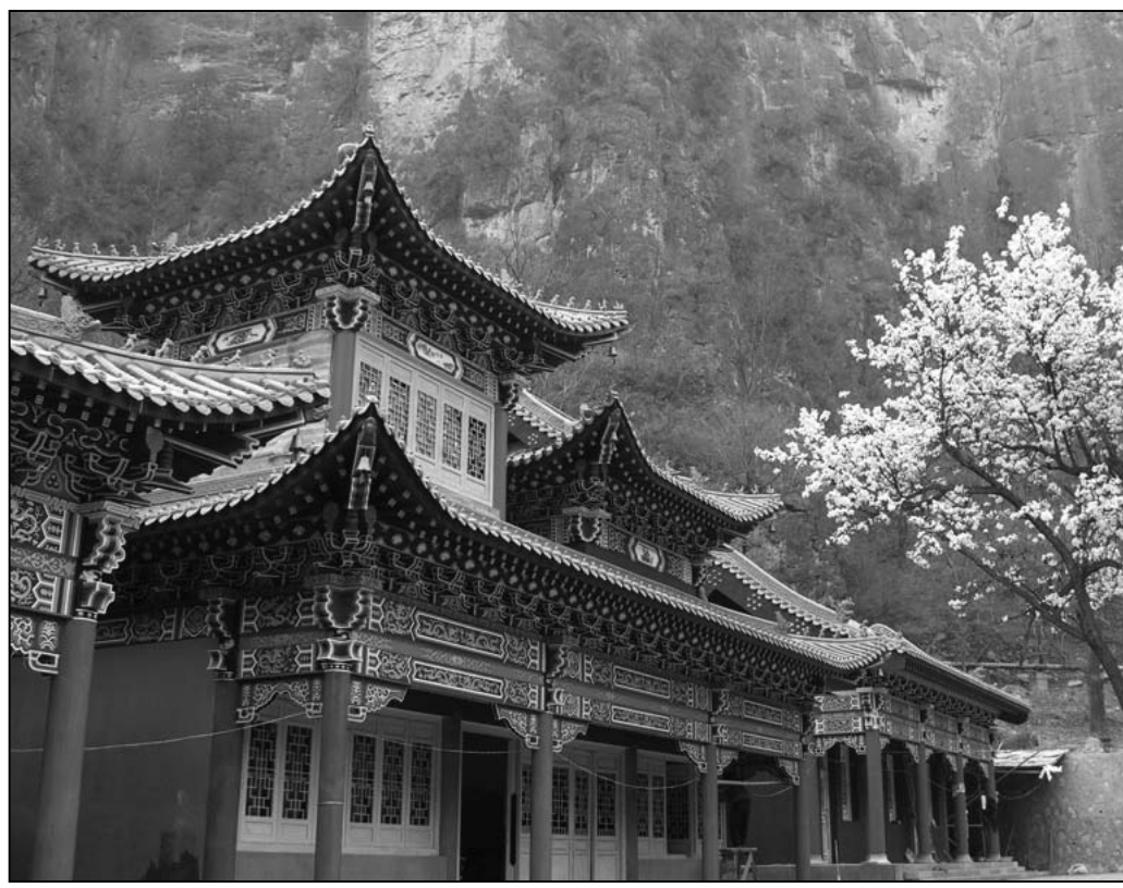
图：千年古刹净影寺

当今的史学家往往把彼时慧远之警戒武帝，视作以地狱威胁对方。其实不然。这是因为这些史学家站在无神论角度来揣度慧远。实际上慧远乃有道高僧，自然对佛法深信不疑，深信破坏佛法要入地狱，是不变的天理。眼见皇帝要入地狱，佛家以慈悲为怀，自然舍命相劝。而武帝对佛法则坚拒不信，所以敢说哪怕自己下地狱也值得。当然不信归不信，有没有因果报应也不是皇帝就能决定的。我们等下