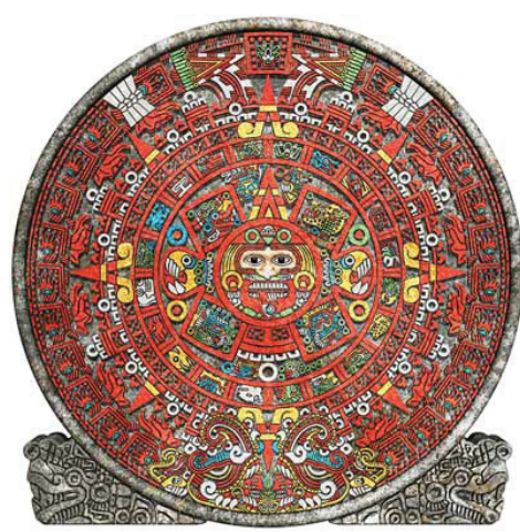
图：玛雅人的历法盘

的记录如同串通好的，全部都在“第五太阳纪”时宣告终结，因此，玛雅预言地球将在第五太阳纪迎向完全灭亡的结局。当第五太阳纪结束时，必定会发生太阳消失，地球开始摇晃的大剧变，根据预言所说，太阳纪只有五个循环，一旦太阳经历过五次死亡，地球就要毁灭，而第五太阳纪始于纪元3 1 1 3年，历经玛雅大周期5 1 2 5年后，迎向最终。而已现今西历对照这个终结日子，就在西元2 0 1 2年1 2月2 2日前后。