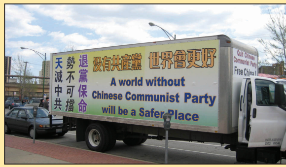
美中十四城市退党箱车之旅 (第七版)