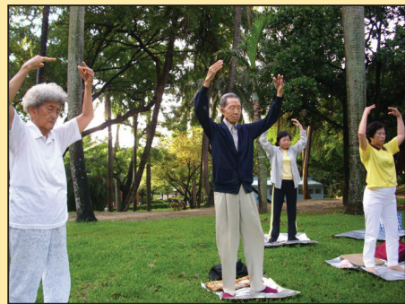
八十八岁时全身病痛 九十八岁却全身轻松 (第四版)