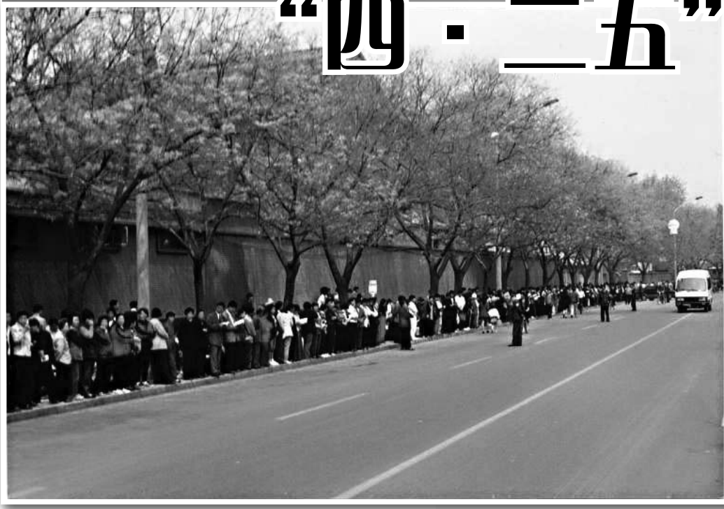
图：1999年4月25日法轮功学员在国务院信访办门外的府右街和平上访