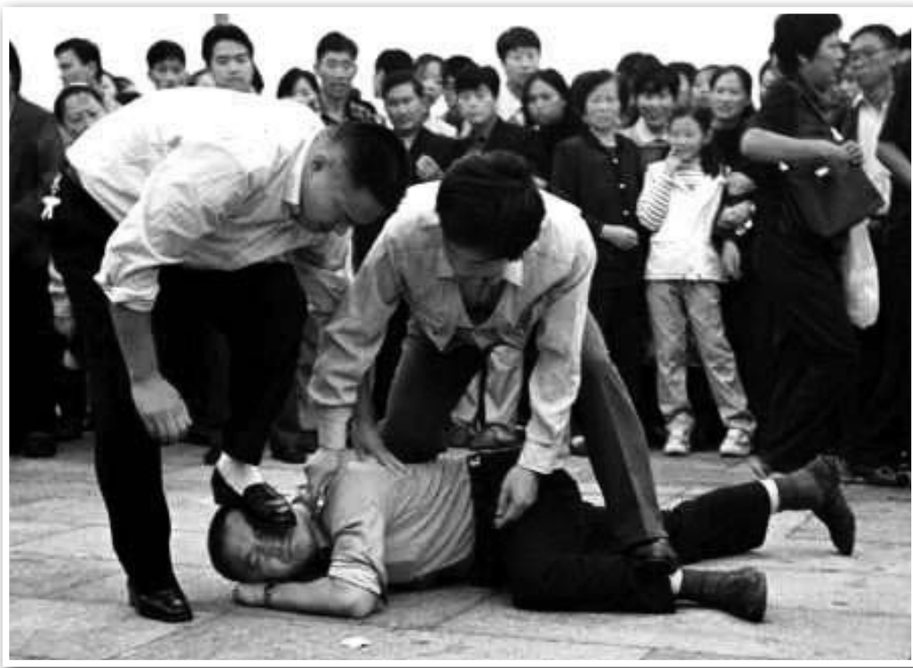
图：法新社照片：和平请愿的学员，被恶警在天安门广场公然践踏在脚下。很难想象这样凶暴的警察对其他公民会客客气气，法轮功学员捍卫的是每一个人的权利。

客户讲完这件事之后，在场的人都笑了，那一刻，我却感到一种深深的辛酸。那几个便衣为什么能如此蛮横无理，不正是中共的暴政机器在背后撑腰吗？而客户的那个朋友，恰恰就是当今在中共统治下，毫无人权可言的民众的缩影啊。究竟是什么原因让人们在听到这样一个令人啼笑皆非的故事时，如此无动于衷，甚而把这样一个严肃的话题当成笑话听呢，也许，这就是在中共建政几十年的暴政下老百姓明哲保身的所谓“生存智慧”吧：唯有逆来顺受，跪着才得以求生。干嘛要做出头的椽子？干嘛要去和共产党较真？难怪在中国的社会里，针砭时政的人常被人嘲讽为“不务正业”。但人们却忽略了，