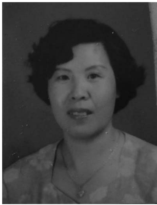
二零零七年两次被非法劳教，被关押到保定劳教所、石家庄劳教所非法劳教。