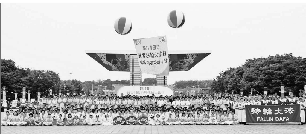
图：二零零九年五月十日，韩国法轮功学员们于首尔的奥林匹克公园和平门庆祝“世界法轮大法日”以及法轮大法洪传十七周年