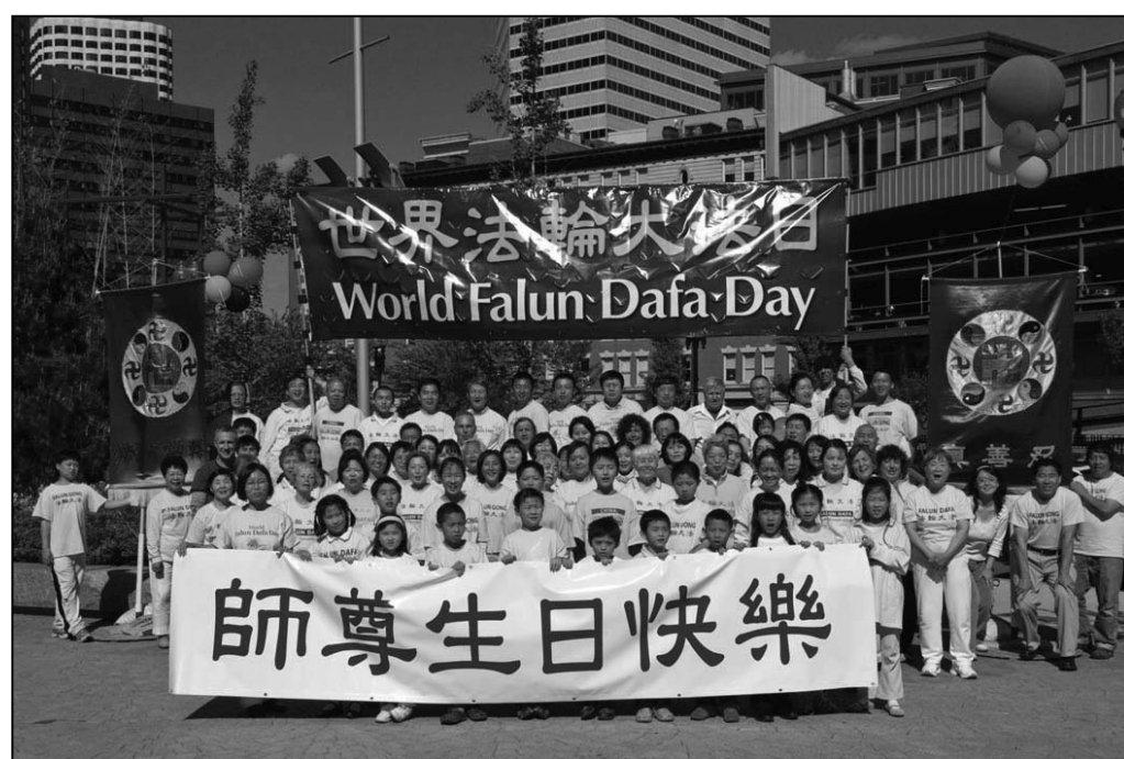
图：波士顿法轮功学员恭祝师尊五十八岁华诞

法日暨师尊华诞。各地大法弟子也在当地举行活动，庆祝自己的节日。美国、加拿大的一些政府官员也对法轮大法给予褒奖。