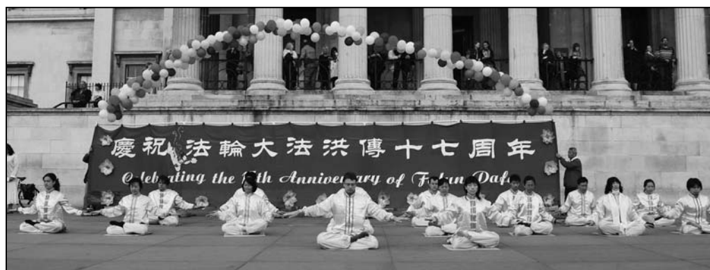
图：英国大法弟子集体炼功