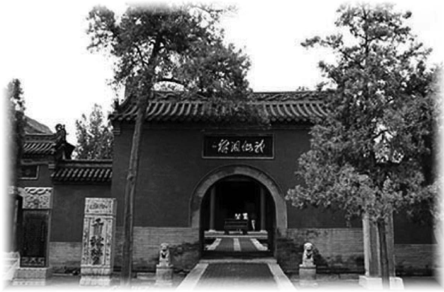
图：位于河北邯郸市的黄梁梦吕仙祠，是北宋时根据“黄梁一梦”的故事建的道观。