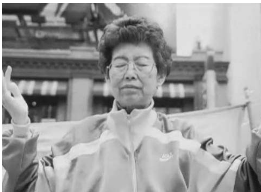
图：魏太太以前第二套功法只能炼几分钟，现在可坚持一小时了