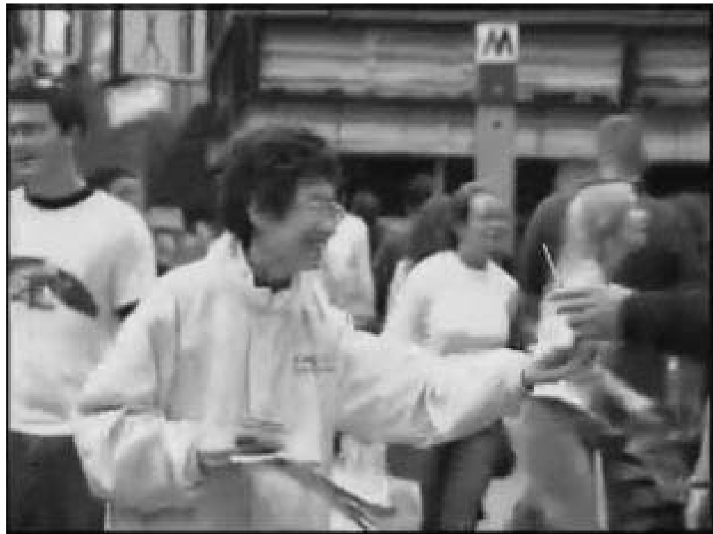
图：魏太太在街上发法轮功真相材料

她说：“那段时间，总感到每天都是那么开心、高兴，法轮功不但让我得到了一个健康的身体，