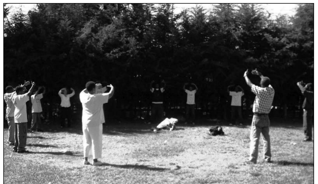
图：埃塞俄比亚法轮功学员集体炼功

许多法轮功学员从修炼中身心受益，也乐于向他人推荐介绍法轮功。这种“人传人，心传心”的弘法方式，也是法轮功广获人心的重要原因。一九九九年十二月下旬，瑞典法轮功学员飞向暑热的南非，在约翰内斯堡市举办法轮功介绍班，再赴南非的西南海岸线上的东伦敦（East London）。二零零