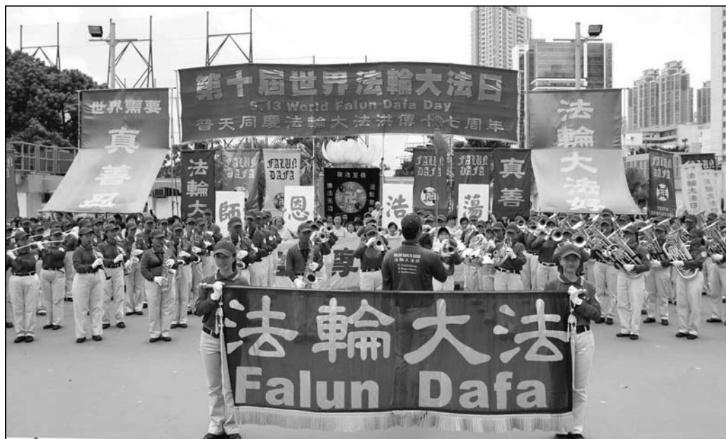
图：香港法轮功学员举行盛大的集会及游行同庆法轮大法日。

悠久传统文化的国家，但中共一贯打压任何精神信仰。所以我希望迫害能够停止，中国人能享有信仰自