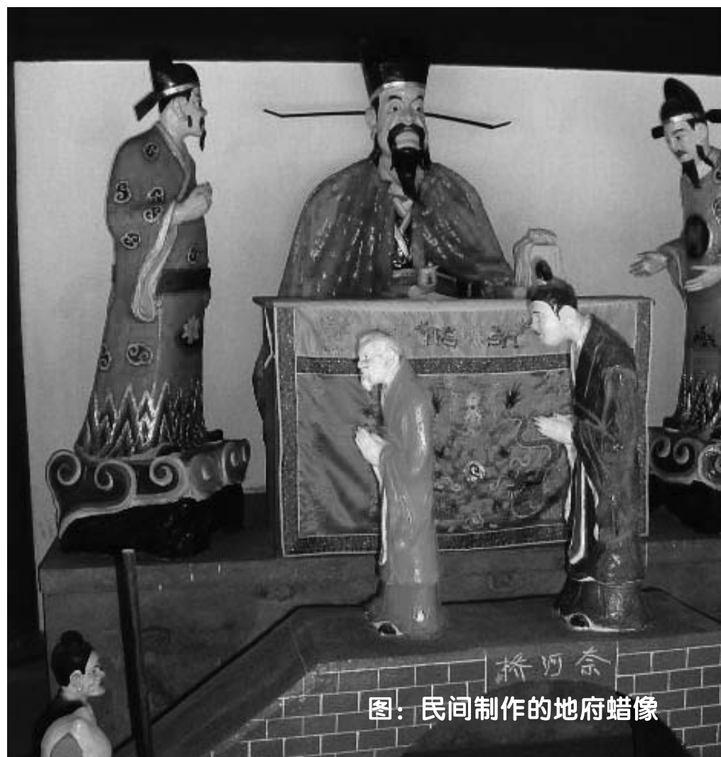
图：民间制作的地府蜡像

过几天，当孩子再来时，老太太笑咪咪的拿出一套光盘说：“拿回去看吧，美极了”。看过光盘后，孩子全明白了，原来妈妈订报纸，只为要一个报箱，目的是接收法轮功学员们投递的光盘资料。