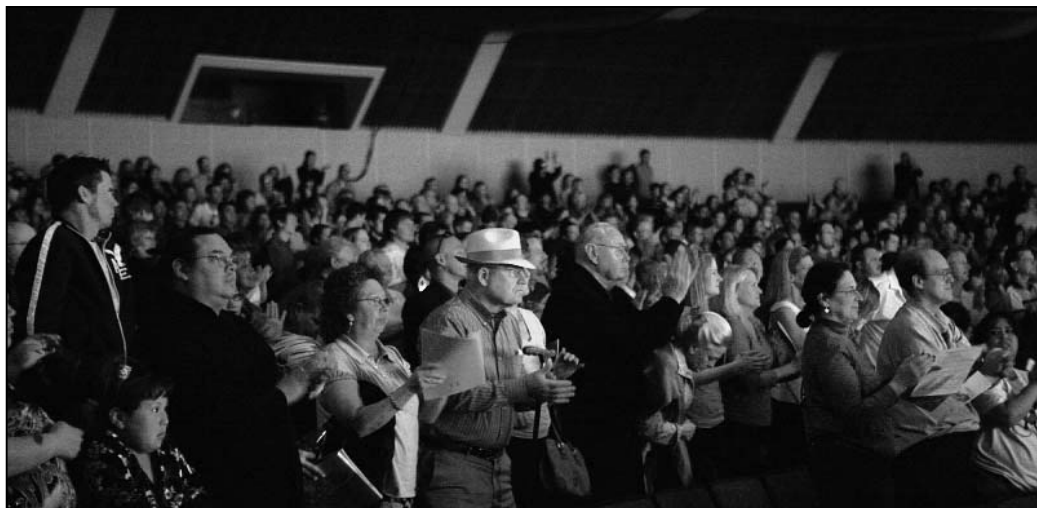
图：斯波坎现场观众起立鼓掌致谢。

前来观赏神韵演出。有19年芭蕾舞经验的她在观看完上半场演出后表示，很欣赏“春之旅”晚会，“(演出)赏心悦目，色彩缤纷，多姿多彩，很喜欢！晚会令人心驰神往！”