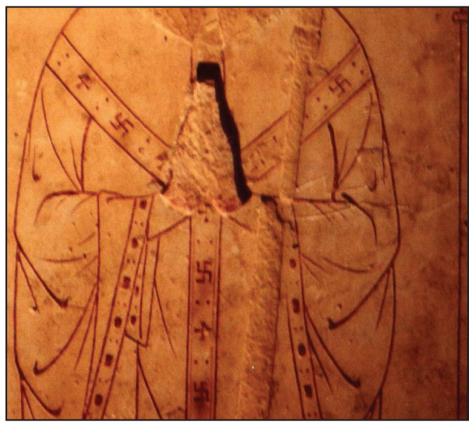
图：修士身上的卍字符以解答的。

许多观察到此细节的人弄不明白：为什么佛教中的东西会跑到天主教中来呢？这个问题对于现在西方宗教中的人也是一定是难