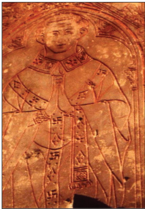
图：修士身上的卍字符

其实，除了东方的佛像之外，卍字符在许多东、西方出土的古文物上都能够找到，甚至在台湾七星山顶的凯达格兰遗迹中，也发现了卍字符的符号。在久远的古代，因为交通不便，东西方文明很少交流。卍字符同时出现在西方和东方的古文物中，其实表明了这个卍字符并不是古人随意编造的符号。实际上，修