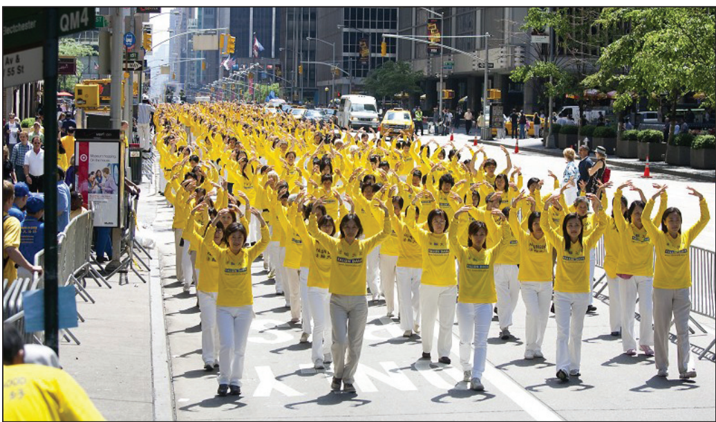
图:六千法轮功学员在纽约曼哈顿举行盛大游行,展示法轮大法好。

游行的第一方阵上百人的天国乐团开路,吹奏的《法轮大法好》、《法鼓法号震四方》、《法正乾坤》、《法轮圣王》在曼哈顿的高楼大厦之间回荡。来自全球四十多个国家的学员举着美丽庄严“法轮大法在各个国家”的横幅。《转法轮》大书和四十多本《转法