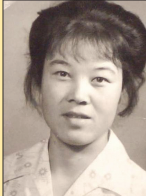
特级教师生前遭受的迫害(第六版)