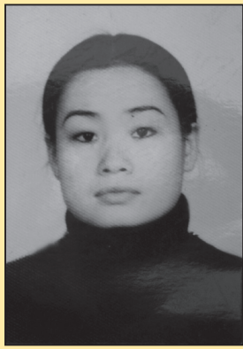
湖南益阳女书法家被折磨瘫痪(第一版)