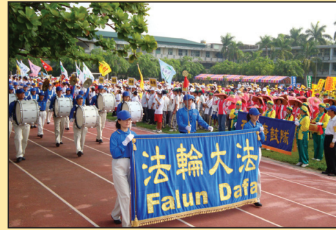
台湾弥陀乡嘉年华