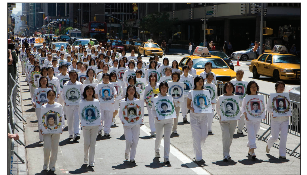
图:数百名法轮功学员素衣白鞋,手持被迫害致死的同修图片

序幕。短短不到五年间,已经有五千五百万中华儿女发表了“退出中国共产党,共青团和少先队”的声明,抹去兽印,获得了新生。从多个方面告诉世人中共正在解体,呼吁世人认识到中共的邪恶,加入到“解体中共,制止迫害”的历史洪流中来。