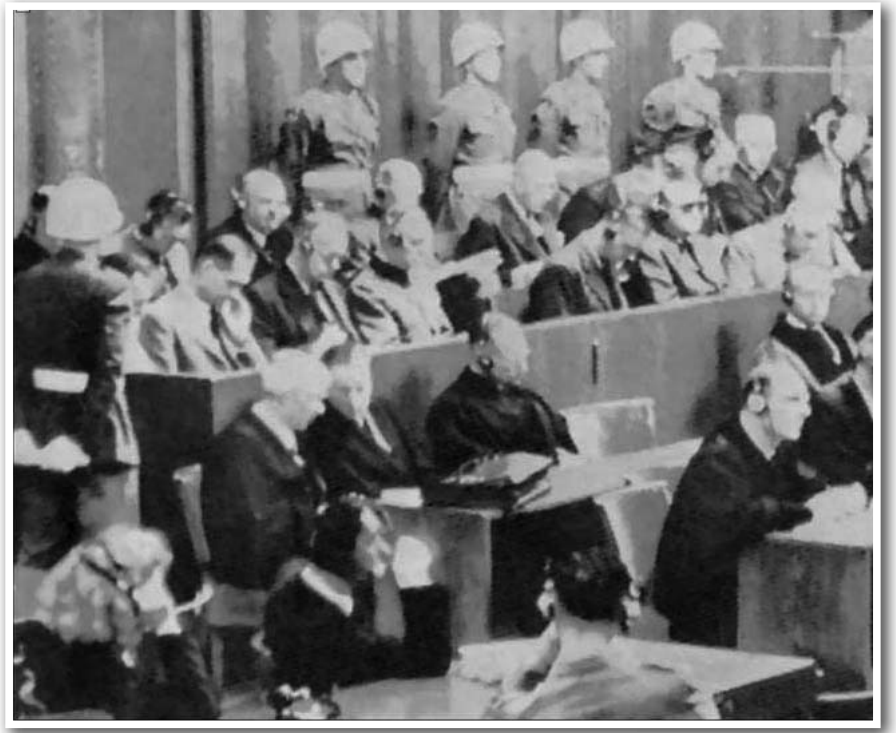
历史图片：纽伦堡大审判

中共对大法和大法弟子进行迫害以来，不论其发布了什么密令、制定了什么所谓的法律，以何种形式制定的所谓法律，其目的都是对“真善忍”和真修向善的人们进行灭绝性迫害。这场迫害从根本上毁坏了人类的道德，使无数世人当了中共陪葬品，就其本质而言是一种