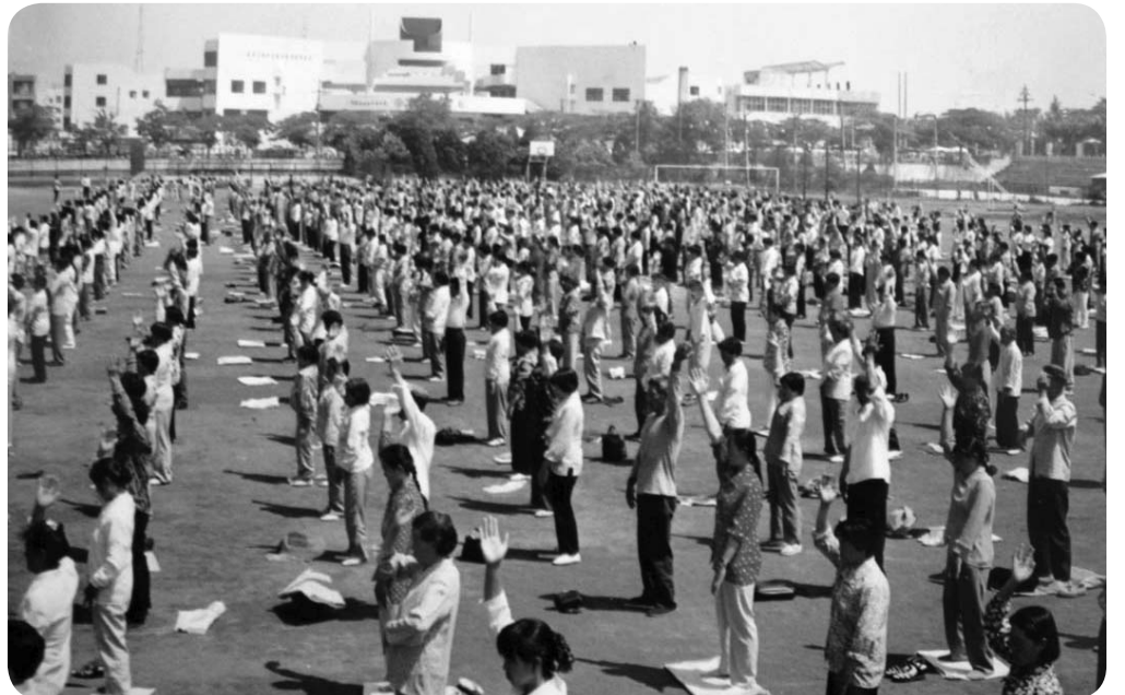
图：一九九八年六月十四日，在莱西体育场展开的大型集体炼功弘法活动。

是恩师给了我第二次生命。整整十四年了，我享受着身体的健康，从未登过医院的大门；十四年啊我心态安详平静感受着浩荡的佛恩。