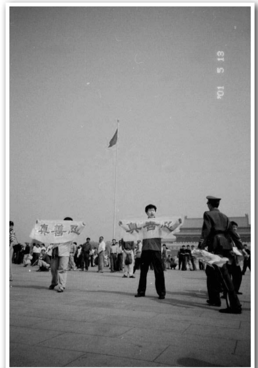
资料图片：大法弟子面临迫害不动摇，在天安门广场打出“真善忍”横幅

故事就讲到这儿。法轮功教人按照“真善忍”提高心性，我们原来就是不说谎的老实人，现在学了法轮功应该做得更好，当然不会昧良心，所以在法轮功问题上决不会人云亦云的。当官的说什么还不是为了他们个人的权力和意志，老百姓自己应该看明白，谁才是真正对自己好的。（选自《明慧周报》大陆版）